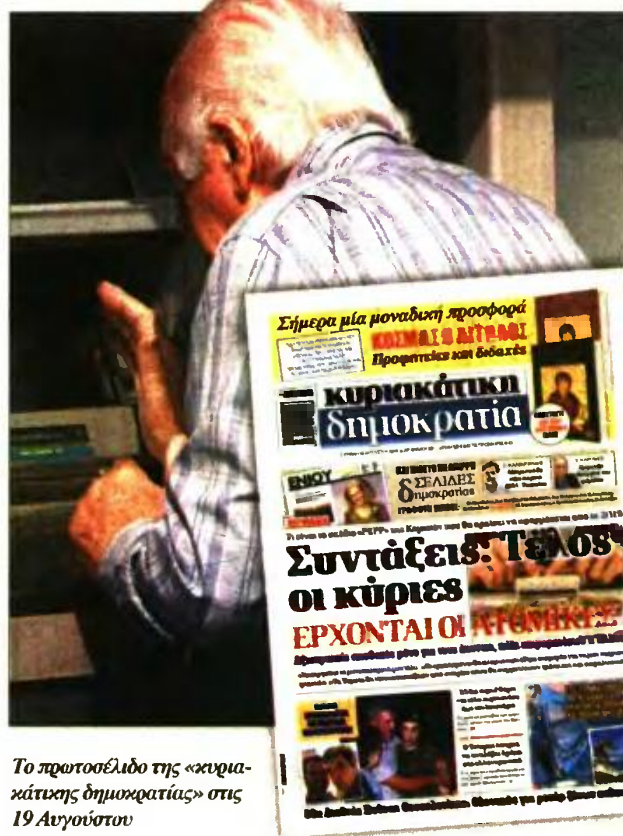
Το πρωτοσέλιδο της «κυριακάτικης δημοκρατίας» στις 19 Αυγούστου

Στο μεταξύ, ο Δημήτρης Τζανακόπουλος υποσχέθηκε παροχές του πρωθυπουργού στη ΔΕΘ με πακέτο μέτρων για την προστασία των κοινωνικών ομάδων που επλήγησαν από τα Μνημόνια.