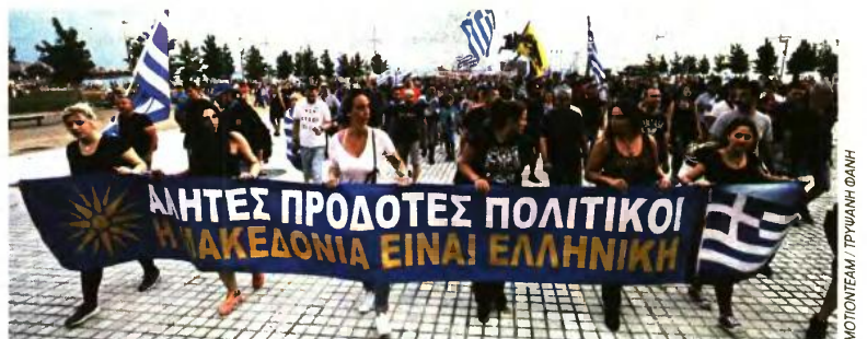
ΜΟΤΙΦΕΤΑΜ: ΤΡΥΦΑΝΗ ΘΑΝΗ

στη δημοσιότητα ολόκληρο το σχέδιο των οργανωτών της εν λόγω εκτροπής, που στήνεται μεθοδικά για να εκτελεστεί το βράδυ της 8ης Σεπτεμβρίου στη Θεσσαλονίκη. Αναλυτικότερα, οι διοργανωτές έχουν αποφασίσει και έχουν γνωστοποιήσει συλλαλητήριο διαμαρτυρίας, με κεντρικό σύνθημα «Μακεδονία