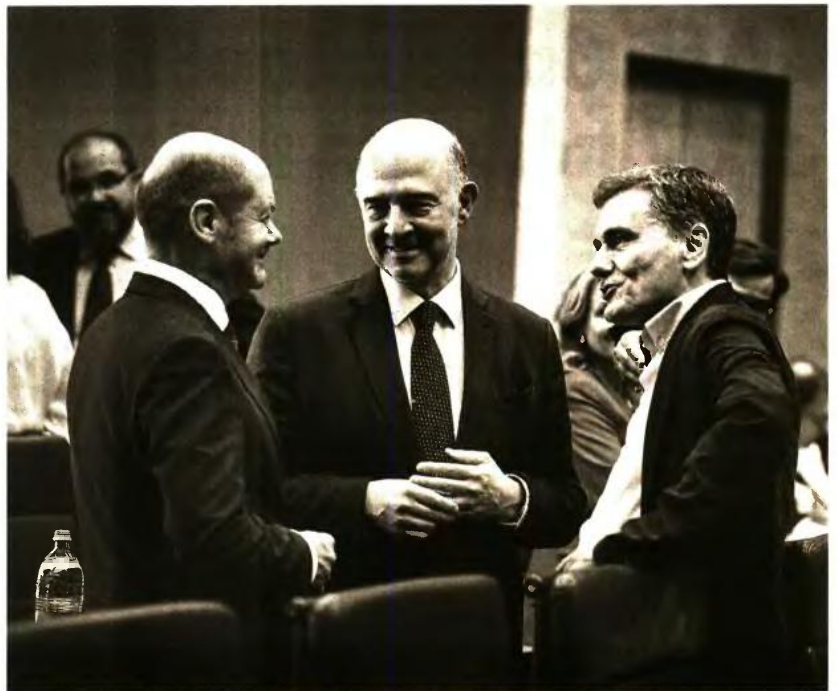
Δύσκολο έργο για το οικονομικό επιτελείο, το οποίο θα πρέπει να φτιάξει για τον πρωθυπουργό εν όψει ΔΕΘ ένα ελκυστικό πακέτο παροχών μίσως και αναστροφής η θλιβερή εικόνα της κυβέρνησης, αλλά και να καταφέρει να αμβλύνει τις αντιδράσεις των δανειστών, οι οποίοι ήδη προειδοποιούν για τήρηση των συμφωνηθέντων.

Εκτός από τις συντάξεις όμως, το οικονομικό επιτελείο θα είναι επιφορτισμένο και με τις τελικές εισπληρώσεις για το πού πρέπει να διατεθεί ως έκτακτη ενίσχυση το υπερπλεόνασμα από 500 έως και 900 εκατ. ευρώ που φαίνεται ότι καταγράφεται για το 2018 και οι φοροαπαλλαγές ύψους 750 εκατ. ευρώ από το υπερπλεόνασμα του 2019.