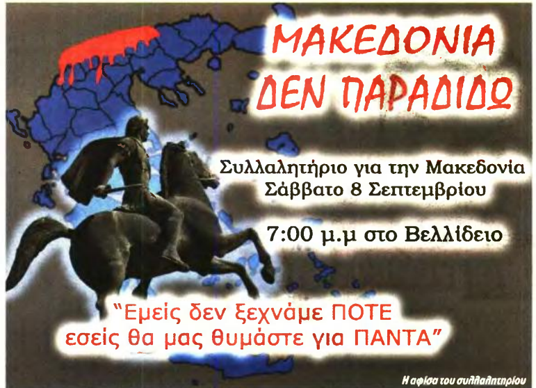
Η αφίσα του συλλαλητηρίου

Βασισμένη σε πλήρως διασταυρωμένες πληροφορίες, η «Εφ.Συν.» φέρνει σήμερα