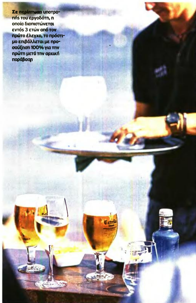
Σε περίπτωση υποτροπής του εργοδότη, η οποία διαπιστώνεται εντός 3 ετών από τον πρώτο έλεγχο, το πρόστιμο επιβάλλεται με προσαύξηση 100% για την πρώτη μετά την αρχική παράβαση

Σε περίπτωση υποτροπής του εργοδότη, η οποία διαπιστώνεται εντός 3 ετών από τον πρώτο έλεγχο, το πρόστιμο επιβάλλεται με προσαύξηση 100% για την πρώτη μετά την αρχική παράβαση και 200% για κάθε μεταγενέστερη παράβαση που διαπιστώνεται σε διαφορετική ημερομηνία. Για εποχικούς εργαζόμενους, οι εργοδότες μπορούν να προβούν σε κατάτμηση της σύμβασης ορισμένου χρόνου. Ο εργοδότης δεν επιτρέπεται να προβεί σε μείωση του προσωπικού ή αλλαγή του καθεστώτος απασχόλησης των εργαζομένων για όλη την περίοδο διάρκειας της έκπτωσης. Αν μειωθεί το προσωπικό, αναβιώνει το σύνολο του προστίμου. Το νέο σύστημα θα ισχύσει αμέσως μετά την έκδοση της προβλεπόμενης υπουργικής απόφασης. Με το ίδιο νομοσχέδιο: ■ Οι άνεργοι που συμμετέχουν σε πρό-