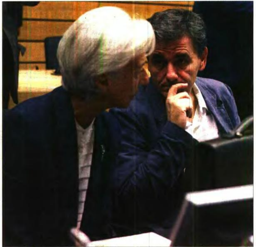
Η διευθύντρια του ΔΝΤ Κριστίν Λαγκάρντ με τον υπουργό Οικονομικών Ευκλείδη Τσακαλώτο

Στην προσπάθειά του να πείσει την επενδυτική κοινότητα να εμπιστευθεί την ελληνική οικονομία, διαβεβαίωσε ότι «δεν θα υπάρχουν εκπτώσεις», ότι οι επενδυτές έχουν, μετά την απόφαση του Eurogroup για το χρέος, «καθαρό διάδρομο 10-15 ετών» και προανήγγειλε ότι ο Οργανισμός Διαχείρισης Δημοσίου Χρέους (ΟΔΔΗΧ) θα παρουσιάσει τη στρατηγική του στα τέλη του έτους, άρα θα επιδιώξει επιστροφή στις αγορές το 2019.