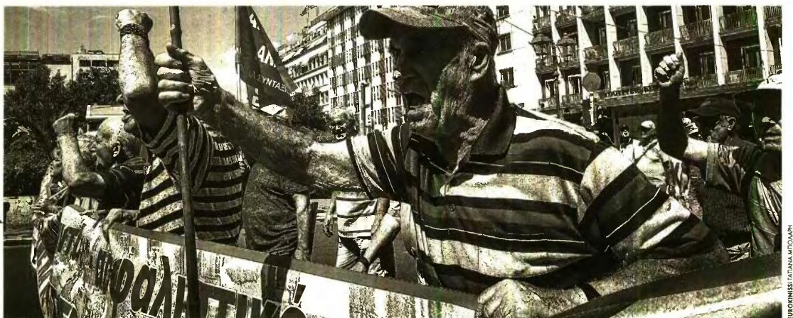
ΕΠΙΧΡΗΣΗ ΠΑΝΑΝ ΜΠΟΛΑΡΗ

Επίσης από τη μελέτη των επιμέρους στοιχείων ανά ηλικία προκύπτει ότι οι συντάξεις των νέων σε ηλικία συνταξιοδότησης είναι οι χαμηλότερες, αφού αφορούν κυρίως συντάξεις λόγω θανάτου (συζύγων και τέκνων) και αναπηρίας (λόγω εργατικού ατυχήματος ή επαγγελματικής ασθένειας).