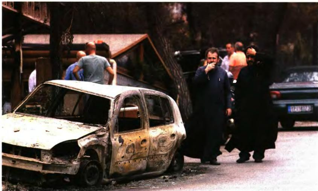
Ο ΑΠΛΟΣ ΚΟΣΜΟΣ ΕΔΕΙΞΕ ΤΟΝ ΔΡΟΜΟ ΤΗΣ ΑΛΛΗΛΕΓΓΥΗΣ ΚΑΙ ΣΤΟΝ ΠΟΛΙΤΙΚΟ ΚΟΣΜΟ