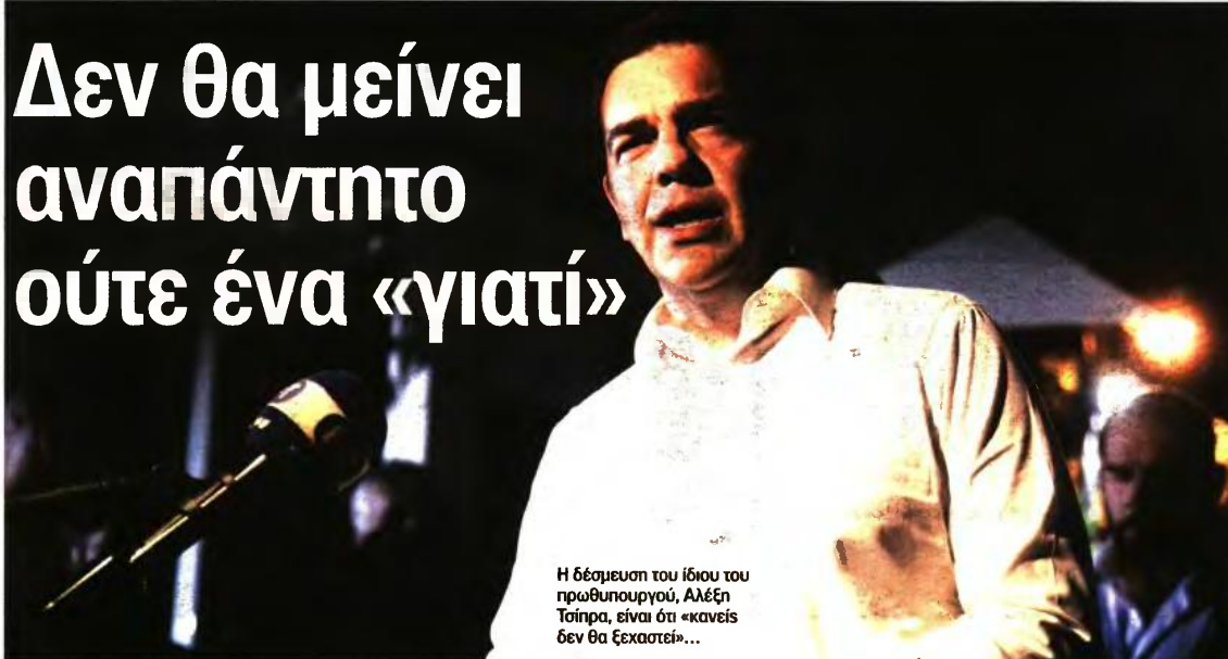
Η δέσμευση του ίδιου του πρωθυπουργού, Αλέξη Τσίπρα, είναι ότι «κανείς δεν θα ξεχαστεί»...

Voice Κιούμενη τις τελευταίες 72 εφιαλτικές ώρες σε αυτούς τους δύο άξονες, θέλει να δείξει ότι συνδράμει έμπρακτα και ουσιαστικά σε όσους πραγματικά έχουν ανάγκη. Οι φονικές πυρκαγιές άφησαν πίσω τους και εκατομμύρια πυρόπληκτους που έχασαν, μέσα σε λίγες ώρες, ολόκληρες περιουσίες. Γι' αυτό και η κυβέρνηση εστιάζει τις παρεμβάσεις της και προς αυτήν την κατεύθυνση.