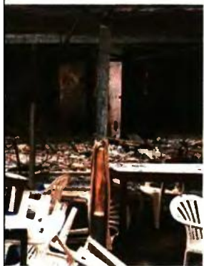
στις δηλώσεις στοιχείων ακινήτων (Ε9), τα οποία ελήφθησαν από τις πρόσφατες πυρκαγιές έως τέλος του τρέχοντος έτους.

Επίσης, για τους κατοίκους των πληγασμένων περιοχών ανιστολή καταβολής βεβαιωμένων οφειλών, που ελήφθη ή θα ληφθούν εντός εξαμήνου από την έκδοσή της.