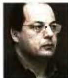
ΤΟΥ ΓΙΩΡΓΟΥ Χ. ΣΩΤΗΡΕΛΗ

Η κυβέρνηση διείδε σωστά την ευκαιρία που παρέχει η διεθνής συγκυρία, αλλά οι αρχικοί – ιδίως – χειρισμοί της ήταν κάκιστοι. Ο Πρωθυπουργός δυστυχώς, για μια ακόμη φορά, δεν τόλμησε να αρθεί στο ύψος του εθνικού ηγέτη, προτιμώντας την πεπατημένη των μικροκομματικών χειρισμών εις βάρος της αντιπολίτευσης (ξεχνώντας όμως το πρόβλημα που είχε στην ίδια την αυλή του, με τους αλλοπρόσαλλους ακροδεξιούς συμμάχους του...). Τώρα δε θριαμβολογεί αντί να δείξει την δέουσα μετριοπάθεια και αυτοσυγκράτηση. Η συμφωνία είναι κατ' αρχάς εθνικά αξιοπρεπής αλλά σε καμία περίπτωση δεν καλύπτει συνολικά τον σκληρό πυρήνα των εθνικών θέσεων. Είναι προφανές ότι κερδίσαμε μεν το όνομα (με γεωγραφικό προσδιορισμό), την αναθεώρηση του Συντάγματος και το «erga omnes», πλην όμως παραχωρήσαμε όχι μόνο τη γλώσσα και (έμμεσα) την εθνότητα αλλά εν μέρει και την ιθαγένεια (καθώς το «μακεδόνας» που προηγείται επισκιάζει το μόνο ορθό «πολίτης της Βόρειας Μακεδονίας»).