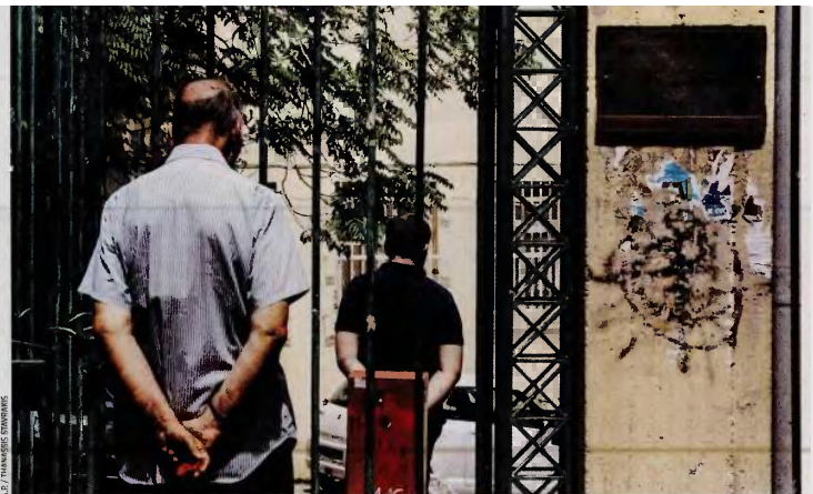
Ώρες αγνίας έξω από το νεκροτομείο Αθηνών, όπου προσέρχονται συγγενείς και φίλοι των νεκρών και αγνοουμένων από την πυρηνή λαίλαπα που έπληξε, την περασμένη Δευτέρα, την Ανατολική Αττική.