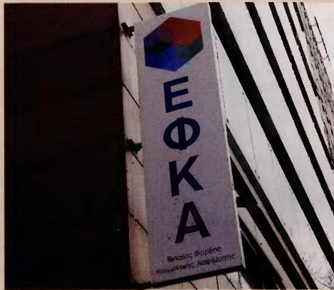
Αχρεωστήτως καταβληθείσες εισφορές θεωρούνται τα χρηματικά ποσά των εισφορών που καταβάλλονται στον ΕΦΚΑ για οποιαδήποτε αιτία και για τα οποία, βάσει της κείμενης νομοθεσίας, δεν προκύπτει υποχρέωση καταβολής τους.

Έτσι, εφόσον μετά τη διενέργεια ελέγχου (δελωθέντων-καταβληθέντων και ουσιαστικού) και την πραγματοποίηση συμψηφισμού προκύψει πιστωτικό υπόλοιπο, αυτό επιστρέφεται άτοκα στους δικαιούχους. Αξίζει επίσης να σημειωθεί ότι, σύμφωνα με την εγκύκλιο, ο συμψηφισμός ή η επιστροφή των αχρεωστήτως καταβληθεισών εισφορών αφορούν χρηματικά ποσά που έχουν κα-