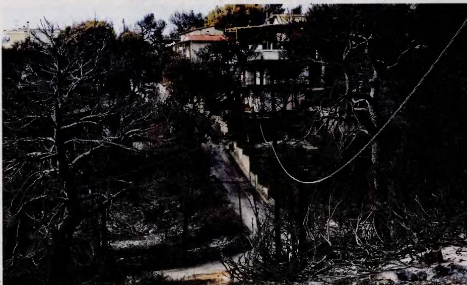
Η έως τώρα επίσημη καταμέτρηση αναφέρει ότι 1.218 σπίτια είναι μη κατοικήσιμα. Η παραθεριστική ή μόνιμη κατοικία, για πολλούς, έγινε στάχτη.