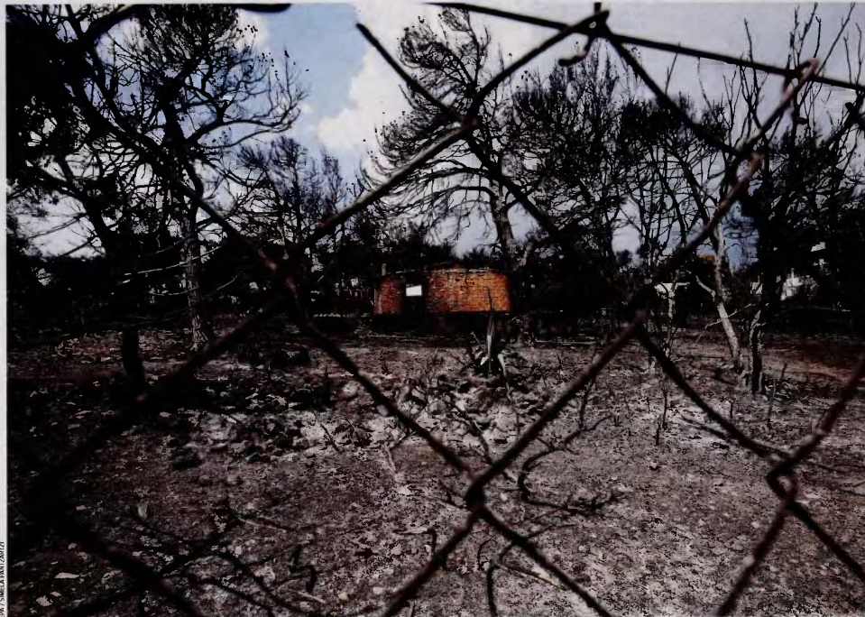
Ένα από τα ζητούμενα προς διερεύνηση είναι εάν δόθηκε εντολή εκκένωσης της περιοχής και πού κατευθύνθηκε ο κόσμος κατά τη διαφυγή του από το Μάτι.

αποτέλεσμα «εγκληματικής ενέργειας». Επιπλέον, πρόσθεσε ότι για «συνειδησιακούς λόγους» έθεσε την παρατήρησή του στη διάθεση του πρωθυπουργού Αλ. Τσίπρα, η οποία ωστόσο δεν έγινε δεκτή. Στις ερωτήσεις εάν η ανταπόκριση του κρατικού μηχανισμού θα μπορούσε να έχει καλύτερα αποτελέσματα, τόσο οι κύριοι Τζανακόπουλος και Τόσκας όσο και οι αρχηγοί της Πυροσβεστικής και της Αστυνομίας