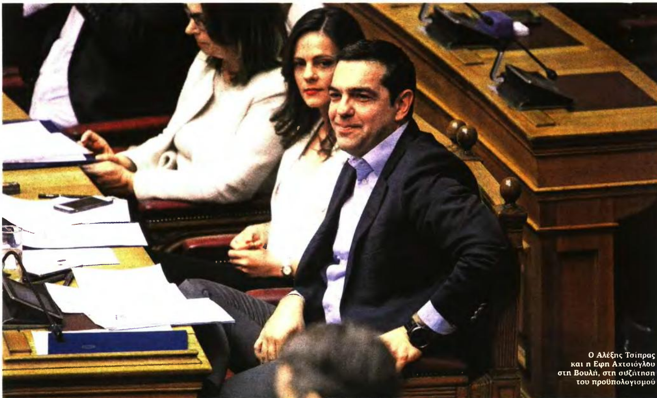
Ο Αλέξης Τσίπρας και η Εφη Αχτσιόγλου στη Βουλή, στη συζήτηση του προϋπολογισμού

Η κυβέρνηση προωθεί νέα ρύθμιση οφειλών με 120 δόσεις, αναπροσαρμογή κατώτατου μισθού και 13η σύνταξη στον... ορίζοντα