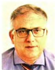
© Τάκης Θεοδωρικάκος Συντονιστής Στρατηγικού Σχεδιασμού και Επικοινωνίας της Ν.Δ.