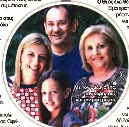
Με τον σύζυγό της, την κόρη τους και την μητέρα της.

Τι σε κάνει ευτυχισμένη στην καθημερινότητά σου; Η πολιτική και η συμμετοχή μου σε εθελοντικά προγράμματα είναι σίγουρα κάτι που μου δίνει χαρά. Όμως, δεν σας κρηκβί ότι η μεγαλύτερη χαρά μου τη δίνει η οικογένειά μου και οι αιήγες, αλλά γεμάτες στιγμές που περνάω μαζί της. Δηλαδή, το να κάνω ποδήλατο με την κόρη μου στις παραλίες του Φαλήρου και της Γλυφάδας.