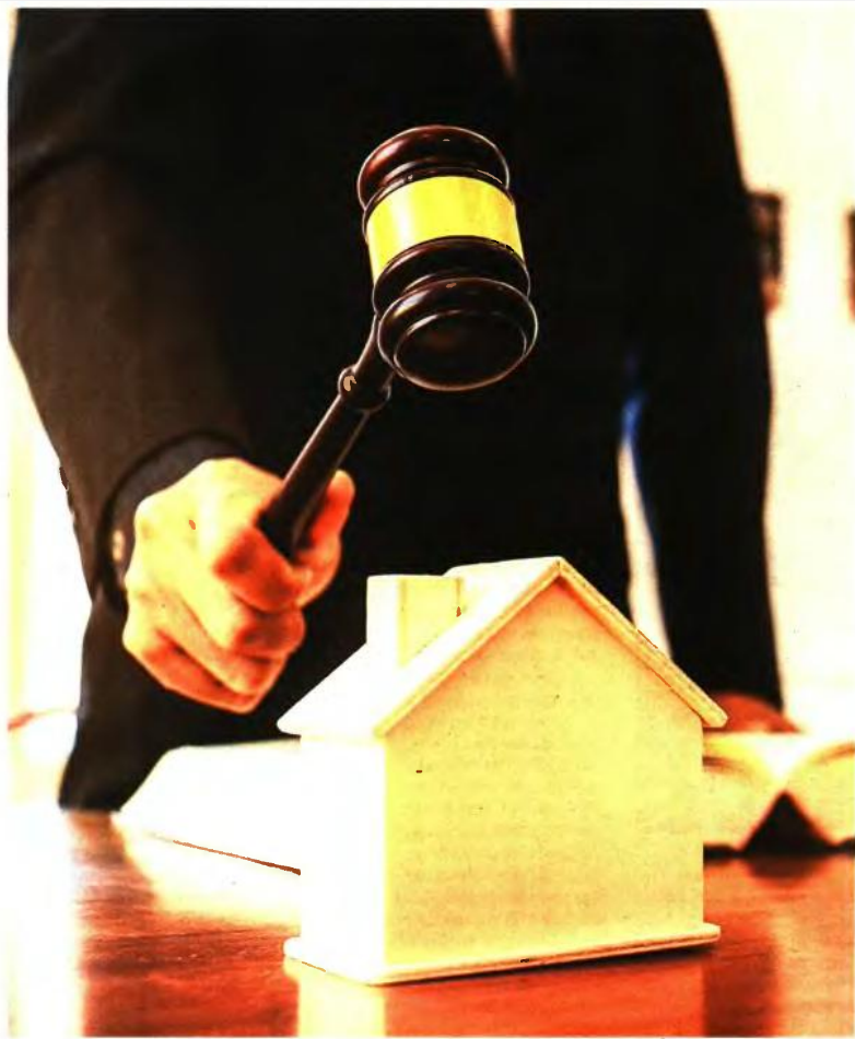
Στην πώληση όσο το δυνατόν περισσότερων ακινήτων που εντάσσονται στα χαρτοφυλάκιά τους μέσω των πλειστηριασμών στοχεύουν οι τράπεζες για να ενισχύσουν τα έσοδά τους

Εκτιμάται πως ένα σημαντικό μέρος της αύξησης αυτής προήλθε από ανακαινίσεις κατοικιών, τόσο σε τουριστικές περιοχές όσο και στα μεγάλα αστικά κέντρα, με σκοπό την εν συνεχεία εκμετάλλευσή τους στην αγορά των βραχυπρόθεσμων μισθώσεων.