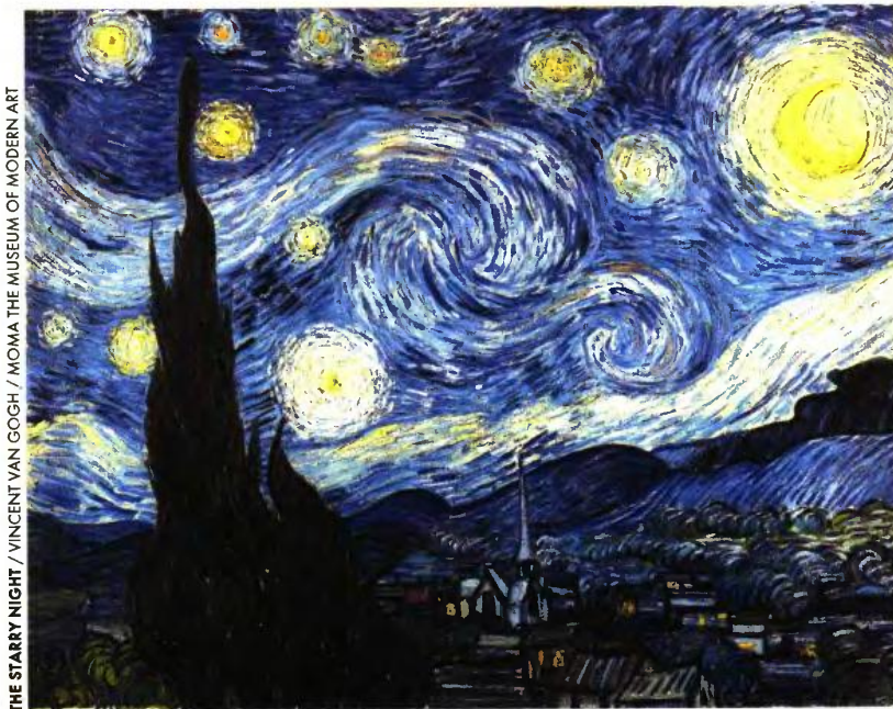
THE STARRY NIGHT / VINCENT VAN GOGH / MOMA THE MUSEUM OF MODERN ART

Ξεκινούμε από τις εθνικές εκλογές, που για τους περισσότερους έχουν, παραδοσιακά, τη μεγαλύτερη σημασία. Αν λάβουμε ως δεδομένες όλες τις δημοσκοπήσεις των τελευταίων δύο ετών, η Νέα Δημοκρατία υπό τον Κυριάκο Μητσοτάκη θα σχηματίσει κυβέρνηση, επιστρέφοντας ύστερα από τέσσερα χρόνια στη διακυβέρνηση της χώρας. Κατά τις ίδιες μετρήσεις, το ζητούμενο στο κλείσιμο του 2018 είναι εάν η ΝΔ του Μητσοτάκη θα καταφέρει να σχηματίσει αυτοδύναμη κυβέρνηση