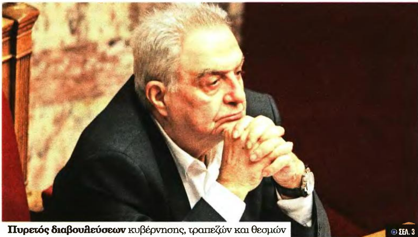
Πυρετός διαβουλεύσεων κυβέρνησης, τραπεζών και θεσμών