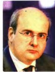
© Κωστής Χατζηδάκης Αντιπρόεδρος Ν.Δ.

μας είναι όχι μόνο να επιβεβαιωθεί η ενόπτιη Νέας Δημοκρατίας, αλλά και να σταλεί ένα μήνυμα εθνικής ενότητας από το Συνέδριό μας, πέρα από τα δικαστικά κηρύγματα του ΣΥΡΙΖΑ. Είμαστε για έτοιμοι σε όλα τα επίπεδα και αυτό θα φανεύει στο τρίημερο του Συνεδρίου. Στο πρόγραμμα της Νέας Δημοκρατίας, για το οποίο έχω την ευθύνη της εκπόνησής του, η δουλειά έχει προχωρήσει πολύ. Μετά την παιδεία, ακολουθεί σε σύντομο χρονικό διάστημα η υγεία. Επιπλέον, έχουμε έτοιμα τα