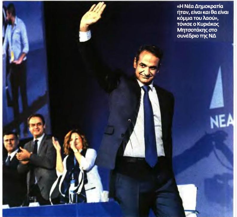
«Η Νέα Δημοκρατία ήταν, είναι και θα είναι κόμμα του λαού», τόνισε ο Κυριάκος Μητσοτάκης στο συνέδριο της ΝΔ

Επιπλέον, άσκησε κριτική στους εταίρους λέγοντας ότι μόνο τυχαία δεν είναι η χρονική σύμπτωση της συμφωνίας των Πρεσπών με την ξαφνική αλλαγή στάσης των εταίρων. «Ο διεθνής παράγοντας θέλει να μπουν τα Σκόπια στο ΝΑΤΟ με κάθε κόστος. Και δεν δυσκολεύτηκε να επιτρέψει στον κ. Τσίπρα να πάρει πίσω το αχρείαστο μέτρο της περικοπής των συντάξεων» τόνισε. Ο κ. Μητσοτάκης επανέλαβε ότι το κόμμα του δεν θα κυρώσει τη συμφωνία των Πρεσπών και ζήτησε από τους πολίτες «να βρεθούν απέναντι