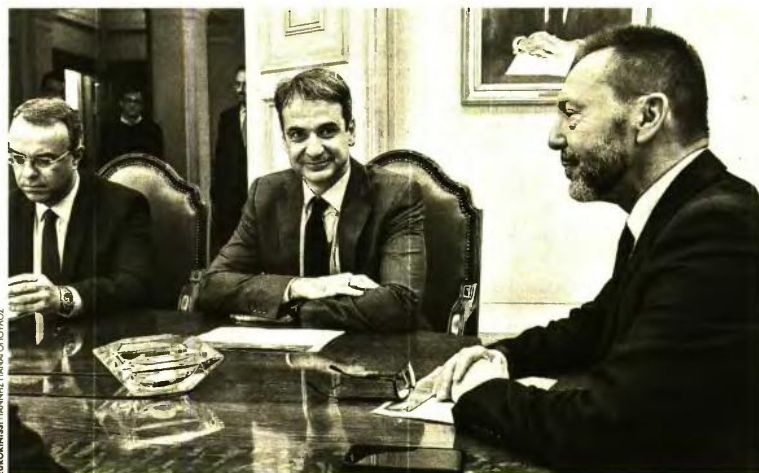
Ο πρόεδρος της ΝΔ Κυριάκος Μητσοτάκης, συνοδευόμενος από τον τομέαρχη Οικονομικών Χρήστο Σταϊκούρα, επισκέφθηκε στο γραφείο του τον διοικητή της Τραπέζης της Ελλάδος Γιάννη Στουρνάρα

Αυστηροποιείται το ισχύον πλαίσιο και θα παρέχει προστασία στοχευμένα σε ασθενείς οικονομικά ομάδες