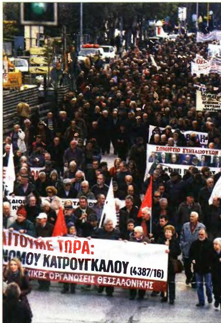
Από τη χθεσινή, δυναμική κινητοποίηση των συνταξιούχων στη Θεσσαλονίκη

Όπως χαρακτηριστικά τόνισαν οι εκπρόσωποι των συνταξιοδικών φορέων, χθες, μετά το τέλος της συγκέντρωσης στη Θεσσαλονίκη, «συνεχίζουμε τον αγώνα μας και απαιτούμε ό,τι μας έχει περικοπεί. Δεκάδες χιλιάδες συνταξιούχοι σε όλη τη χώρα απαι-