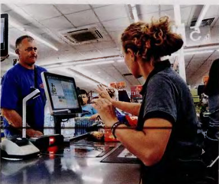
Οι εργαζόμενοι έχασαν το 32,5% του εισοδήματός τους, ενώ οι μισθωτοί το 38,6% και οι αυτοαποσπασόμενοι το 40,3%.

που μεγαλώνει σε μια φτωχή οικογένεια να καταλήξει κι αυτό φτωχό ως ενήλικας; Και πόσες είναι οι πιθανότητες να ζήσει μια πιο άνετη ζωή; Σύμφωνα με τη μελέτη, το 59,5% ατόμων ηλικίας 25-29 ετών που «τα έβγαζε» πέρα δύσκολο στην Ελλάδα είχε μεγαλώσει σε οικογένειες που και αυτές τα έβγαζαν πέρα δύσκολα (54,9% στο σύνολο της Ε.Ε.). Σύμφωνα με τα ίδια στοιχεία, στην Ελλάδα είναι 2,2 φορές πιθανότερο κάποιος που έχει μεγαλώσει σε οικογένεια που τα «βγάζει» πέρα δύσκολα να τα βγάλει πέρα δύσκολα σήμερα ως ενήλικας, παρά να τα «βγάζει» πέρα εύκολα. Η σχετική πιθανότητα στην Ε.Ε. είναι ακόμη μεγαλύτερη όμως: 2,8 φορές. Η οικονομική κατάσταση των γονιών κρυσταλλώνει την πιθανότητα να κληρονομήσει ένα λιγότερο πιθανό να προσδιορίζεται την οικονομική δραστηριότητα που στην Ελλάδα από ό,τι στην Ε.Ε.