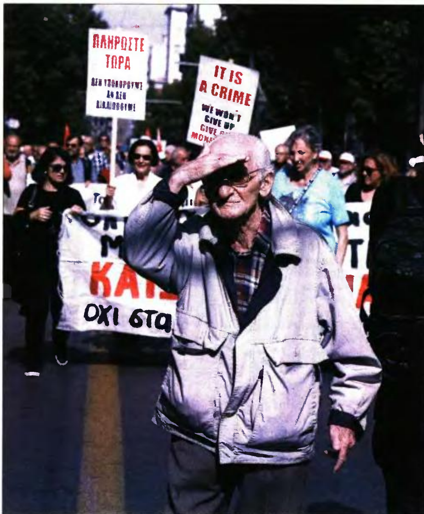
Στιγμιότυπο από τη χθεσινή πορεία διαμαρτυρίας των συνταξιούχων

Εκτός από την κατάργηση του νόμου Κατρούγκαλου, που έχει ως αποτέλεσμα οι συντάξεις να μειώνονται σε ποσοστό 20%-25%, έχοντας καταντήσει «προνοιακά επιδόματα», οι συνταξιούχοι λένε «όχι» στην εφαρμογή της μείωσης με την προσωπική διαφορά στις κύριες και τις επικουρικές συντάξεις, στη μείωση του αφορολογήτου, στην περικοπή των οικογενειακών επιδομάτων, του ΕΚΑΣ και των συντάξεων χρειάς, και απαιτούν δημόσιο σύστημα κοινωνικής ασφάλισης και δημό-