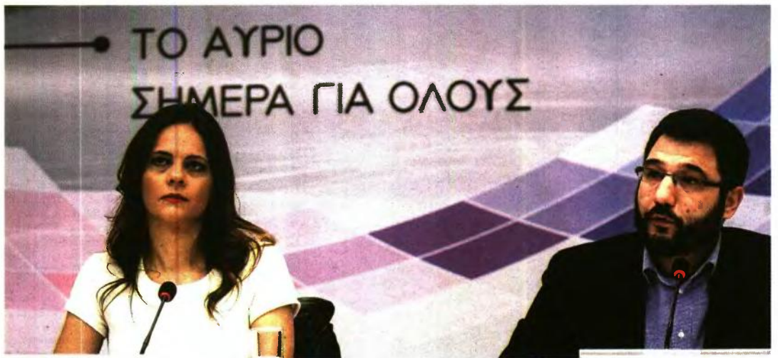
ΕΦΗ ΑΧΤΣΙΟΓΛΟΥ Υπουργός Εργασίας, Κοινωνικής Ασφάλισης & Κοινωνικής Αλληλεγγύης

Συνέχεια έχει τρίτο πρόγραμμα για 10.000 ανέργους που θα βγει εντός του Οκτωβρίου 2018. Προβλέπει επιδότηση νέων θέσε-