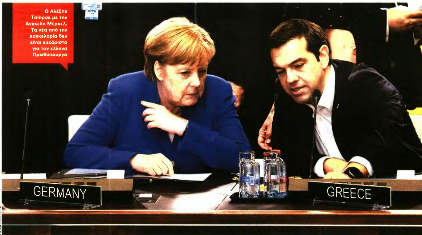
Ο Αλέξης Τσίπρας με την Ανγκελα Μέρκελ. Τα νέα από την καγκελαρία δεν είναι ευχάριστα για τον έλληνα Πρωθυπουργό

ΤΟ ΠΑΡΑΔΕΙΓΜΑ ΤΟΥ ΦΠΑ για τα νησιά είναι ενδεικτικό και ταυτόχρονα διδακτικό για τη στάση που θα τηρεί το Βερολίνο οσάκις τίθεται ζήτημα αναθεώρησης των συμφωνηθέντων. Λίγες ημέρες μετά το Eurogroup του Ιουνίου, η κυβέρνηση αποφάσισε την παράταση του μειωμένου συντελεστή ΦΠΑ σε πέντε νησιά του Αιγαίου για έξι μήνες, μέχρι τα τέλη του τρέχοντος έτους. Και