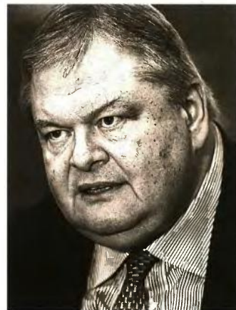
ΑΠΕ-ΜΠΕ ΟΡΕΣΤΗΣ ΠΑΝΑΓΙΩΤΟΥ

ΤΟ ΣΚΟΠΙΑΝΟ. Σχετικά με τη συμφωνία των Πρεσβών, ο Βενιζέλος τόνισε πως «ο κ. Τσίπρας προσωπικά ως Πρωθυπουργός, αν ήθελε, μπορούσε να διαμορφώσει μία πραγματική, στέρεη εθνική συναίνεση». Ωστόσο κάτι τέτοιο δεν συνέβη, καθώς η αντιπολίτευση ήταν στο σκοτάδι καθ' όλη τη διάρκεια της διαπραγμάτευσης. Για το τι μέλλει γενέσθαι στο Σκοπιανό επισήμανε πως η ελληνική πλευρά πρέπει να περιμένει αν θα γίνουν δεκτές οι συνταγματικές αλλαγές στην ΠΓΔΜ, κάνοντας «πολύτιμο εθνικό χρόνο». Η αποχή στο δημοψήφισμα, όμως, έδειξε, καταρχήν, πως «η μοσή τουλάχιστον κοινωνία και παραπάνω είναι αδιάφορη για το περιβόητο momentum».