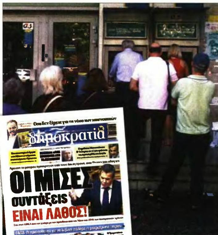
Συνταξιούχοι σε ΑΤΜ. Ενθετη: Το πρωτοσέλιδο της «δημοκρατίας» στις 9 Αυγούστου

καταβολής του προβλεπόμενου ποσού εξαγοράς, ως συντάξιμες αποδοχές ορίζεται το ποσό που θα αντιστοιχούσε στον ασφαλιστέο μηνιαίο μισθό - εισόδημα αν εκλαμβάνονταν ως μηνιαία εισφορά το ποσό που καταβλήθηκε για την εξαγορά κάθε μήνα ασφάλισης».