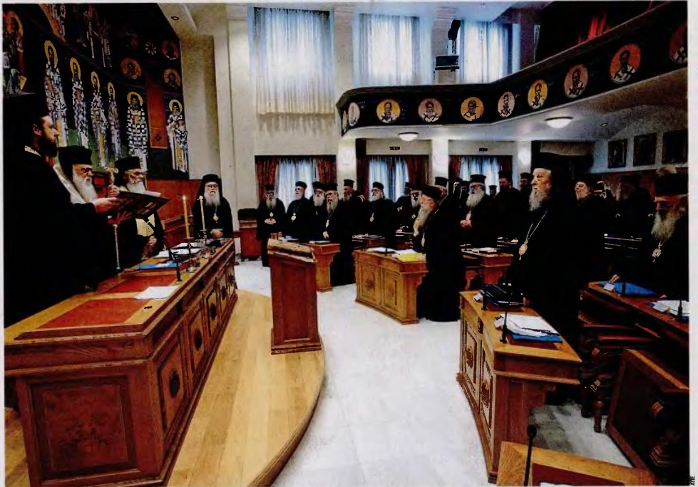
Στη Σύνοδο της Ιεραρχίας, την Παρασκευή, η αντιπαράθεση μεταξύ μητροπολιτών που τάχθηκαν υπέρ ή κατά της συμφωνίας ήταν οξεία.

Την ίδια στιγμή, η κρίση στην Ιεραρχία έδωσε την ευκαιρία να αμφισβητηθεί ο κ. Ιερώνυμος. Είναι