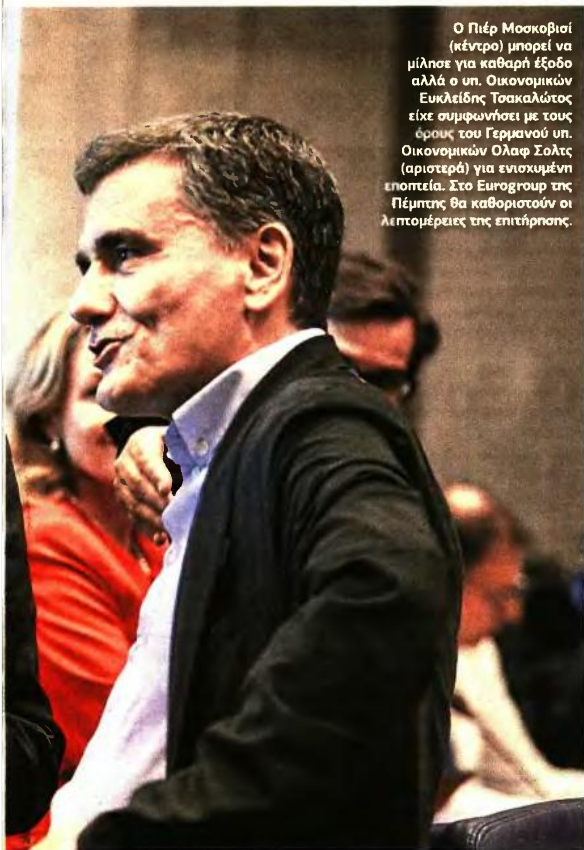
Ο Πιέρ Μοσκοβισί (κέντρο) μπορεί να μίλησε για καθαρή έξοδο αλλά ο υπ. Οικονομικών Ευκλείδης Τσακαλώτος είχε συμφωνήσει με τους όρους του Γερμανού υπ. Οικονομικών Ολαφ Σολτς (αριστερά) για ενισχυμένη εποπτεία. Στο Eurogroup της Πέμπτης θα καθοριστούν οι λεπτομέρειες της επιτήρησης.