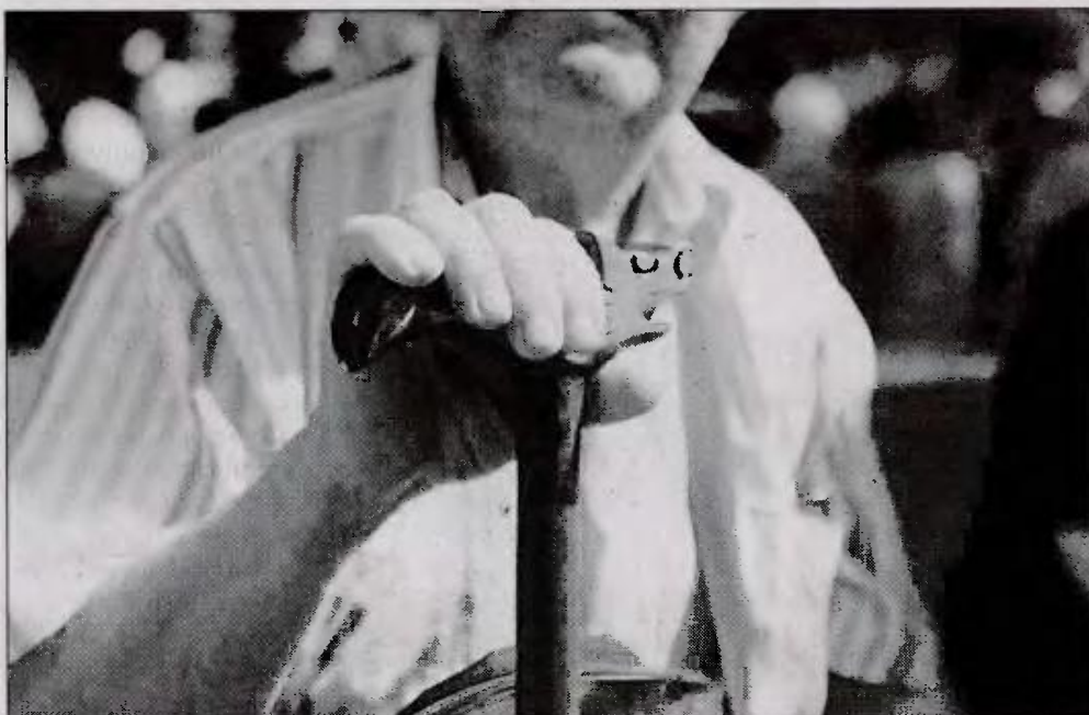
■ Ο πληθυσμός τής Ελλάδος μειώνεται και γερνά

Η ίδια δηλώνει ότι ή σχετική έκδοσις, εκτάσεως 734 σελίδων, έχει ως στόχο «νά αποδείξει ότι κατά τή διάρκεια τής κρίσης μεγάλα τμήματα του έλληνικού πληθυσμού βρίσκονται "υπό διωγμόν", ύφίστανται, δηλαδή, συστηματική ύποβολή σέ ταιλαιπωρίες, πού έχουν όδηγήσει ή θά καταλήξουν στό μέλλον στην άπομάκρυνσή τους από τήν Ελλάδα, από τήν οικογένειά τους, από τή δουλειά τους, από τούς φίλους τους, άκόμη και από τή ζωή». Συμπληρώνει δέ ότι: «Οί δημογραφικοί δείκτες εξελίσσονται μέ βραδύ ρυθμό και βελτιώνονται μέ άκόμη βραδύτερο. Άν, όμως, ή στρατηγική πού έχει ως στόχο τήν αύξηση τών γεννήσεων, τήν επιβράδυνση του ρυθμού γήρανσης, τόν περιορισμό τής άποδημίας, δέν εφαρμοστεί