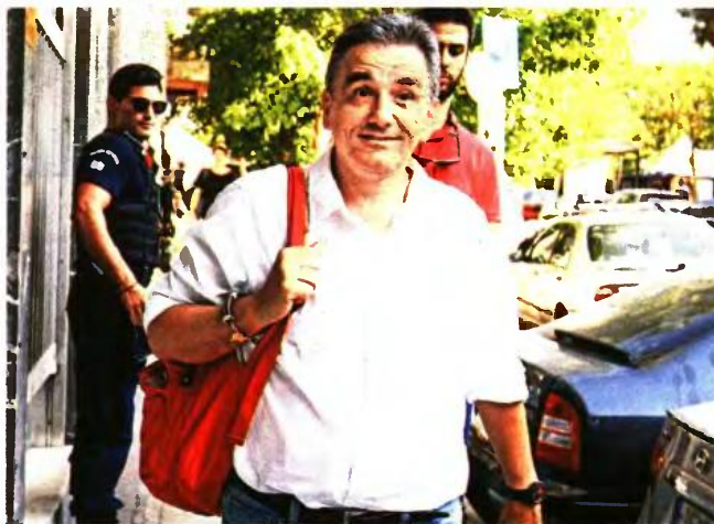
ΕΥΡΟΚΙΝΗΣΗ / ΚΟΝΤΑΡΙΝΗΣ ΠΙΠΙΡΙΩΤ

νης ωφέλειας και της Εκκλησίας. Για τα ακίνητα πολιτιστικού ενδιαφέροντος θα χρειαστεί να γίνει κατηγοριοποίηση και να εκπονηθεί ολοκληρωμένο πρόγραμμα για την καλύτερη αξιοποίησή τους. Να σημειωθεί ότι σε πολλές περιπτώσεις εκκρεμούν διεκδικήσεις από τους παλιούς ιδιοκτήτες, ενώ υπάρχουν και καταπατήσεις από γείτονες.