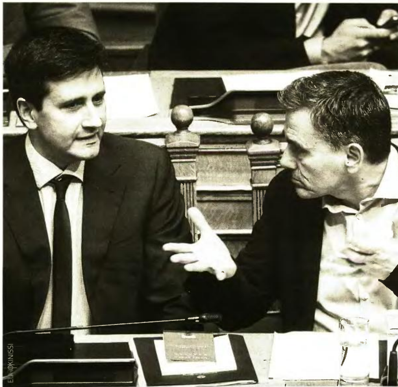
Δύσκολη η μη εφαρμογή της περικοπής του αφορολόγητου που ζητά ο υπ. Οικονομικών, Ευκ. Τσακαλώτος, αφού το μέτρο έχει διαρθρωτικό χαρακτήρα όπως είχε παραδεχτεί και ο αναπληρωτής υπουργός Γ. Χουλιαράκης.

ΤΑΣΟΣ ΔΑΣΟΠΟΥΛΟΣ tdasopoulos@e-typos.com