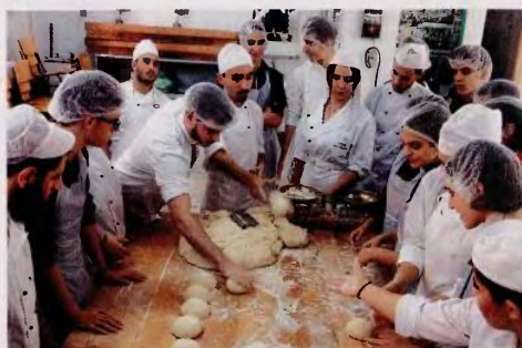
Η εκπαίδευση είναι θεωρητική, αλλά και εργαστηριακή, ενώ οι μαθητές κάνουν την πρακτική τους άσκηση σε πραγματικές συνθήκες εργασίας.