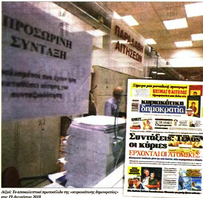
Δεξιά: Το αποκαλυπτικό πρωτοσέλιδο της «κυριακάτικης δημοκρατίας» στις 19 Αυγούστου 2018

Οι συντάξεις και οι παροχές θα προκύψουν με βάση τις εισφορές που θα έχει καταβάλει κάθε εργαζόμενος και από τις αποδόσεις που θα επιτυγχάνονται από τις επενδύσεις των αποθεματικών (αναμένεται να κυμανθούν σε αρκετές εκατοντά-