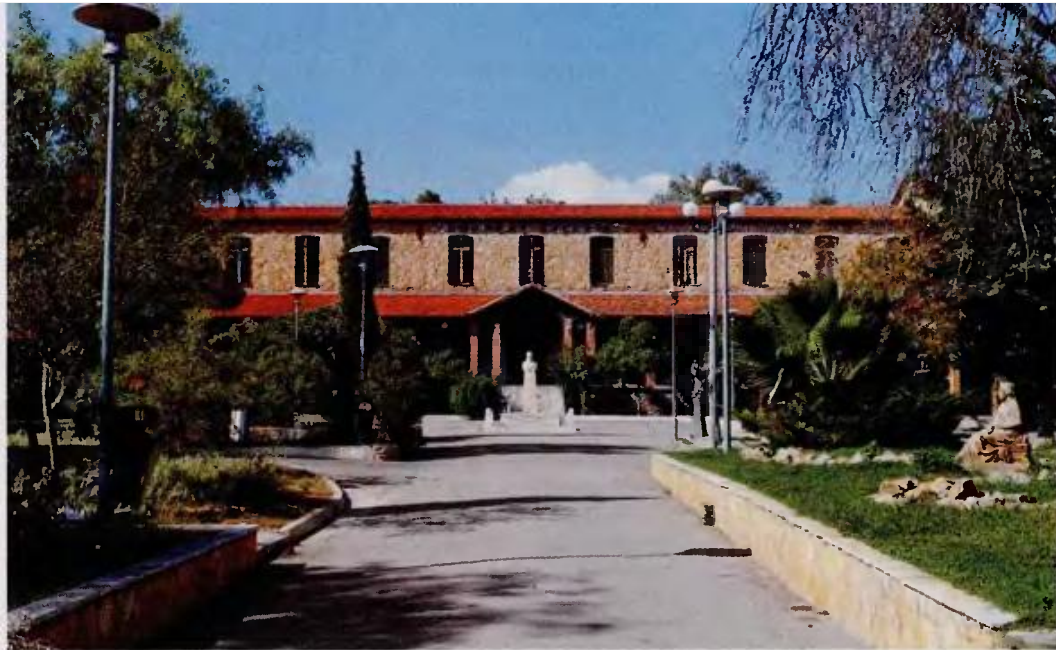
Το κτίριο του Γηροκομείου Αθηνών αποτελεί αρχιτεκτονικό κόσμημα για την Αθήνα. Παρά τους στολισμούς των ημερών, η χριστουγεννιάτικη ατμόσφαιρα ήταν βαριά, οι ηλικιωμένοι κλεισμένοι στα δωμάτιά τους και οι προκλήσεις αμέτρητες.