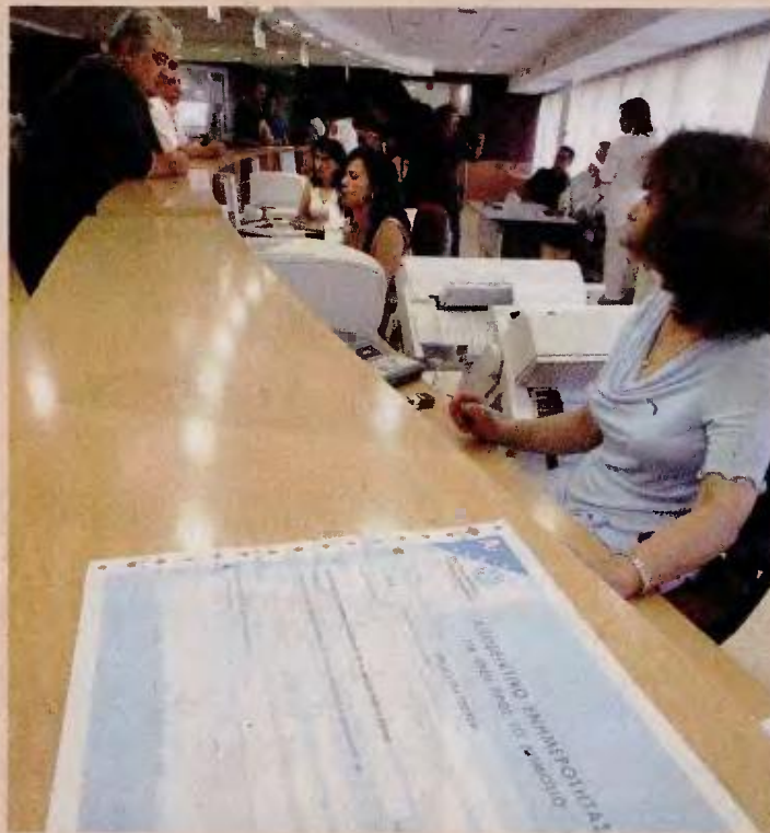
Πάνω από 5 εκατομμύρια φορολογούμενοι θα πρέπει να εξοφλήσουν μέχρι τις 31 Δεκεμβρίου τα τέλη κυκλοφορίας του 2019 συνολικού ύψους 1,1 δισ.

3. Οι ιδιοκτήτες ακινήτων πρέπει να καταβάλουν την τέταρτη δόση του φετινού ΕΝΦΙΑ. Αν δεν το πράξουν, τότε θα επιβαρυνθούν με πρόστιμο. Να σημειωθεί ότι η 5η και τελευταία δόση του ΕΝΦΙΑ