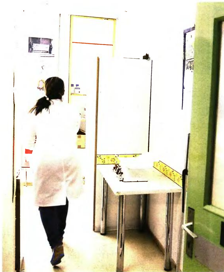
Σε λίγα 24ωρα αναμένεται να αποχωρήσουν περίπου 700 γιατροί από το δημόσιο σύστημα υγείας

Από την πλευρά του ο υπουργός Υγείας υπερασπίζεται των αποφάσεών του δηλώνοντας μεταξύ άλλων: «Το υπουργείο Υγείας εξάντλησε όλα τα περιθώρια νομοθέτησης ευνοϊκών ρυθμίσεων που δημιουργούν κίνητρα παραμονής στο Δημόσιο Σύστημα Υγείας. Έχουμε ήδη προβλέψει τη δυνατότητα για τους γιατρούς που έχουν "νοσοκομειακές" ειδικότητες να έχουν ενεργό συμμετοχή στην πρωινή και απογευματινή λειτουργία, αλλά και στην εφημερία των όμορων νοσοκομείων. Έτσι αναίτηρα το επιχείρημα της επιστημονικής απαξίωσης των ειδικευμένων γιατρών της ΠΦΥ και της απαγόρευσης άσκησης κλινικού έργου που δεν μπορεί να προσφερθεί σε επίπεδο ΠΦΥ» ●