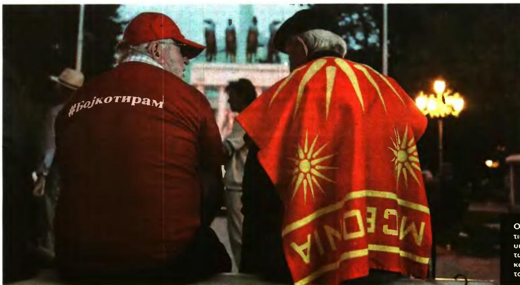
Όπως ανακοίνωσε αργά το βράδυ ο κυβερνητικός εκπρόσωπος Μίλε Μπασακφάσκι, το υπουργικό συμβούλιο διαμόρφωσε το κείμενο των συνταγματικών αλλαγών, στο προοίμιο και στα άρθρα που είχε προαναγγείλει και θα το προωθήσει στη Βουλή για διαβουλεύσεις.

Βεβαίως δεν υπάρχει καμία απολύτως εγγύηση ότι και σε περίπτωση πρόωρων εκλογών οι 605.000 ψήφοι που στο δημοψήφισμα τάχθηκαν υπέρ της συμφωνίας των Πρεσβών θα κατευθυνθούν συστηματικά στο κυβερνών SDSM και τα συμμαχικά αλβανικά κόμματα, ενώ και πάλι δεν θα είναι εύκολη η εξασφάλιση της πλειοψηφίας των 2/3. Ο γγ. της Συμμαχίας, Πεντ Στόλτενμπεργκ, πάντως με νέα παρέμβασή του, αυτή τη φορά από το Βελιγράδι, προειδοποίησε ότι η ένταξη στο NATO μπορεί να γίνει μόνο με την ολοκλήρωση της συμφωνίας των Πρεσβών, μια προειδοποίηση που απευθύνεται κυρίως στην αντιπολίτευση, που υποστηρίζει ότι επιθυμεί την ένταξη στο NATO και στην Ε.Ε. αλλά απορρίπτει τη συμφωνία των Πρεσβών ως προϋπόθεση για την ευρωπαϊκή πορεία της χώρας.