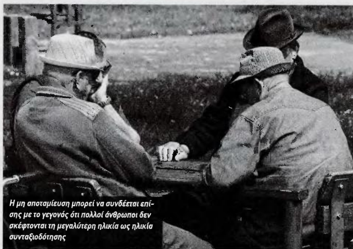
Η μη αποταμίευση μπορεί να συνδέεται επίσης με το γεγονός ότι πολλοί άνθρωποι δεν σκέφτονται τη μεγαλύτερη ηλικία ως ηλικία συνταξιοδότησης

Τα δύο πέμπτα των ατόμων παραγωγικής ηλικίας (43%) βασίζονται για να ζήσουν στα χρήματα που κερδίζουν καθημερινά, ενώ 42% αποταμιεύει προκειμένου να επιτύχει βραχυπρόθεσμους