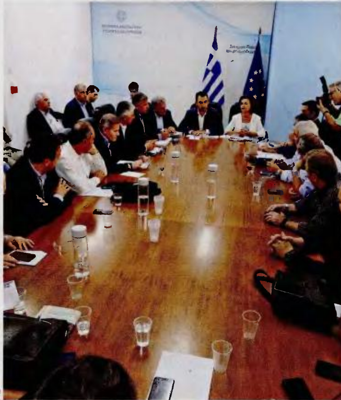
Ο υπουργός Εσωτερικών Αλέξης Χαρίτσης συναντήθηκε χθες με το διοικητικό συμβούλιο της Κεντρικής Ένωσης Δήμων Ελλάδας.

Ο πρόεδρος της ΚΕΔΕ αναφέρθηκε επίσης στο σοβαρό πρόβλημα της έλλειψης βρεφονηπιακών σταθμών. «Οι δήμοι έχουν ώριμες μελέτες για νέες δομές αλλά οι περιφέρειες δεν τις χρηματοδοτούν, με συνέπεια να μένουν