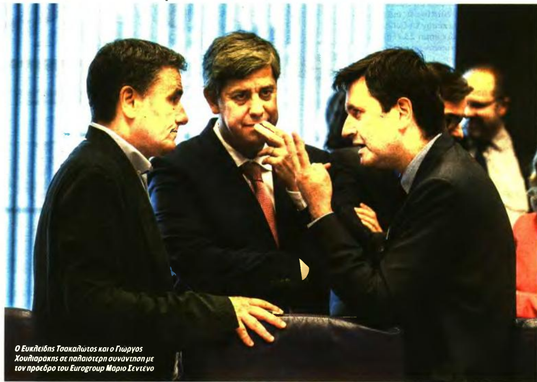
Ο Ευκλείδης Τσακαλώτος και ο Γιώργος Χουλιαράκης σε παλαιότερη συνάντησή με τον πρόεδρο του Eurogroup Μαριο Σεντενο

Βόλτες συνομιλίες για τα σενάρια της μη περικοπής των συντάξεων που βρίσκονται πάνω στο τραπέζι είχε χθες το μεσημέρι με τους θεσμούς ο υπουργός Οικονομικών Ευκλείδης Τσακαλώτος, μπαίνοντας έτσι «εμβόλιμα» στο πρόγραμμα των συναντήσεων που κανονικά ήταν μόνο σε τεχνικό επίπεδο. Επειδή, όμως, η κυβέρνηση έχει επενδύσει πολιτικά πάνω σε αυτό το ζήτημα, προσπαθεί να εξασφαλίσει τη συναίνεση όλων των δανειστών και όχι μόνο της Ευρωπαϊκής Επιτροπής, που στηρίζει με το παραπάνω τις ελληνικές θέσεις, ότι το μέτρο δεν είναι διαρθρωτικό. Εφόσον αυτό το εξασφαλίσει, θα ήθελε μια γρήγορη απάντηση από την πλευρά του κουαρτέτου για το θέμα των συντάξεων, ώστε αυτή να προλάβει να αποτυπωθεί και στο προσχέδιο του προϋπολογισμού του 2019.