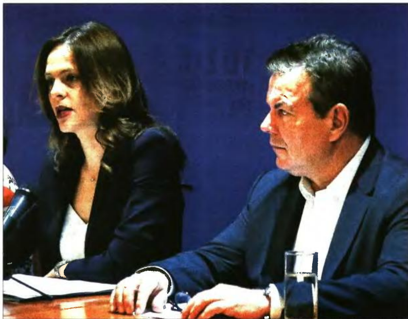
Η υπουργός Εργασίας Εφη Αχτσιόγλου και ο υφυπουργός Τάσος Πετρόπουλος στη χθεσινή συνέντευξη Τύπου για τις εισφορές

Στο πλαίσιο αυτό, η κυρία Αχτσιόγλου προχώρησε στην εξειδίκευση του μέτρου της ασφαλιστικής ελάφρυνσης μερίδας μη μισθωτών ασφαλισμένων (ελεύθεροι επαγγελματίες, αγρότες, αυτοαπασχολούμενοι γιατροί, μηχανικοί και δικηγόροι). Σύμφωνα με την υπουργό Εργασίας, από την 1η Ιανουαρίου 2019, διατηρώντας την