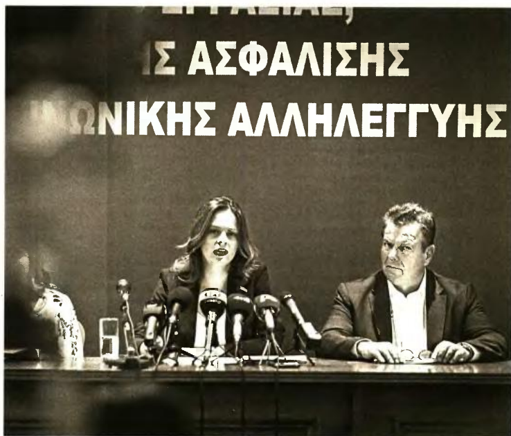
«Τα κεφαλαιοποιητικά συστήματα, που ευαγγελίζεται ο κ. Μητσοτάκης, λειτουργούν στο πλαίσιο του επενδυτικού κινδύνου και εξαρτώνται από τις διακυμάνσεις των αγορών σε παγκόσμιο επίπεδο», τονίζει η υπουργός Εργασίας, Εφη Αχτσιόγλου, ενώ ο υφυπουργός Τάσος Πετρόπουλος συμπληρώνει ότι είναι αμφίβολο εάν υπάρχουν αμιγώς ελληνικές εταιρείες που διαθέτουν τα απαιτούμενα ελάχιστα κεφάλαια

3 Σε ό,τι αφορά τους σημερινούς 2,8 εκατ. ασφαλισμένους στο επικουρικό ταμείο, το σχέδιο αφαιρεί πόρους από το δημόσιο σύστημα επικουρικής ασφάλισης με τους οποίους αναμένουν να χρηματοδοτηθούν όχι μόνο οι σημερινοί αλλά και οι μελλοντικοί συνταξιούχοι – σημερινοί ασφαλισμένοι του δημόσιου συστήματος καθώς οι εισφορές που έχουν ήδη καταβάλει