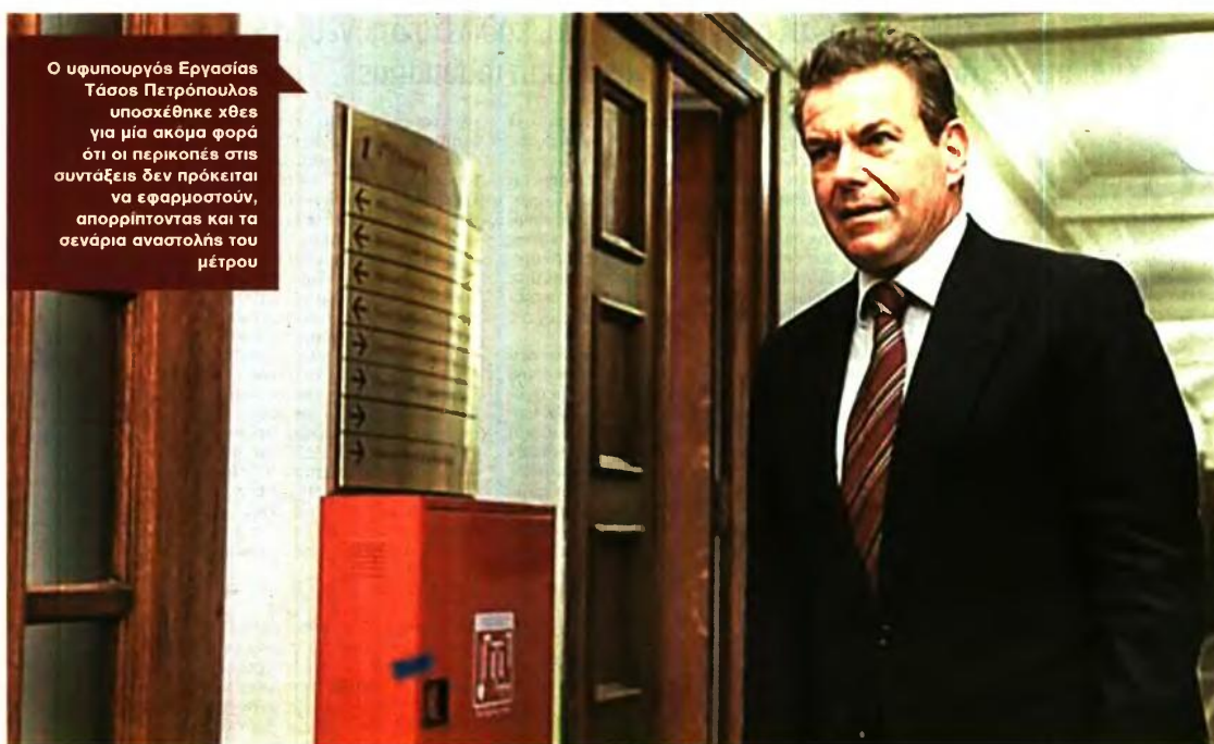
Ο υφυπουργός Εργασίας Τάσος Πετρόπουλος υποσχέθηκε χθες για μία ακόμα φορά ότι οι περικοπές στις συντάξεις δεν πρόκειται να εφαρμοστούν, απορρίπτοντας και τα σενάρια αναστολής του μέτρου

Ταυτόχρονα, όμως, η κατάθεση του μπρώου δεν έχει υποχρεωτικό χαρακτήρα και εφόσον η εργοδοτική