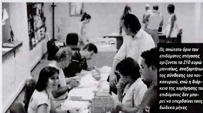
Ός ανώτατο όριο του επιδόματος στέγασης ορίζονται τα 210 ευρώ μηνιαίως, ανεξαρτήτως της σύνθεσης του νοικοκυριού, ενώ η διάρκεια της χορήγησης του επιδόματος δεν μπορεί να υπερβαίνει τους δώδεκα μήνες

Μονογονεϊκά οικογένεια: ένας μόνος γονέας