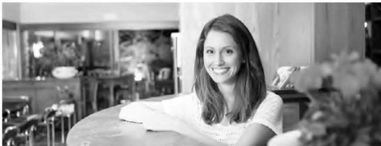
γειρικής Τέχνης – Αρχιμάγειρας (chef).

Στην Κέρκυρα η ζήτηση είναι μεγάλη Μετά την εισαγωγή των 75 νέων καταρτιζόμενων, ο συνολικός αριθμός τους στο ΙΕΚ τουρισμού Κέρκυρας θα ανέβει στους 200 και για τις τρεις ειδικότητες κατάρτισης: 1) Τεχνικών Τουριστικών Μονάδων και Επιχειρήσεων Φιλοξενίας (Υπηρεσία υποδοχής-Υπηρεσία οράφων-Εμπορευματογνωσία), 2) Τεχνικών Μαγειρικής Τέχνης – Αρχιμάγειρας (chef) και 3) Τεχνικών Αρτοποιών-Ζαχαροπλαστικής. Να σημειωθεί ότι για την τρίτη ειδικότητα δεν έχουν προκηρυχθεί θέσεις, δεδομένου ότι θα λειτουργήσει φέτος για δεύτερη χρονιά και δεν έχει ακόμα αποφοιτούς, ώστε να ανοίχουν θέσεις για νέους καταρτιζόμενους. Πάντως αξίζει να σημειωθεί ότι πριν από δύο χρόνια στο ΙΕΚ λειτουργούσαν μόλις δύο τμήματα των 25 καταρτιζόμενων, ενώ τη νέα χρονιά αναμένεται να λειτουργήσουν οκτώ. Κι εάν στους 200 σπουδαστές συμπληρωθούν και οι 100, που πραγματοποιούν μεταπτυχιακή κατάρτιση, τότε ο συνολικός αριθμός καταρτιζόμενων στο ΙΕΚ Κέρκυρας φέτος θα φτάσει τα 300 άτομα, γεγονός το οποίο αναδεικνύει την ζήτηση, που υπάρχει.