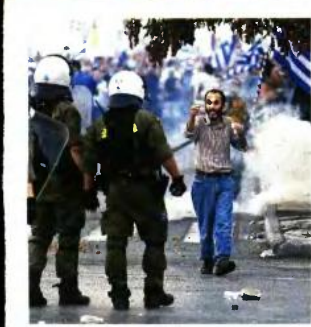
Η μεγάλη συγκέντρωση για τη Μακεδονία «πνίγηκε» στα χημικά, που έρχιναν ανεξέλεγκτα οι άνδρες των ΜΑΤ