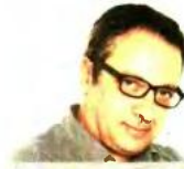
Θεωρείο ΤΟΥ ΠΕΡΙΚΛΗ ΔΗΜΗΤΡΟΠΟΥΛΟΥ

Ε τσι θα πορευτεί η κυβέρνηση. Αποφεύγοντας ή και ενοχοποιώντας τις ενοχλητικές ερωτήσεις. Υποχρέωση της δημοσιογραφίας είναι να τις θέτει – και όταν χρειάζεται να δίνει εκείνη τις απαντήσεις που αποφεύγουν οι κυβερνώντες. Αυτό είναι η δημοκρατία.