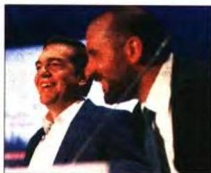
Ο Αλέξης Τσίπρας με τον Δημήτρη Τσανακόπουλο στη χθεσινή συνέντευξη Τύπου

Σκληρή επίθεση εξαπέλυσε και το Κίνημα Αλλαγής, κατηγορώντας τον πρωθυπουργό ότι παρουσιάζει μια εικονική πραγματικότητα και ζητώντας ως μόνη λύση για τη χώρα «εκλογές τώρα και αλλαγή πολιτικής». Για το Κίνημα Αλλαγής ο κ. Τσίπρας εμφανίστηκε στη ΔΕΘ «αμετανοήτος και προκλητικός για την κοινή λογική, στην τελευταία του παράσταση ως πρωθυπουργός», ενώ τονίζεται ότι «το μόνο αξιοσημείωτο με τις αναφορές του για τις εκλογές είναι ότι επιτέλους κατάλαβε ότι ο χρόνος της κυβέρνησής