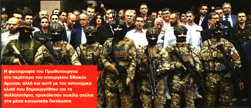
Η φωτογραφία του Πρωθυπουργού στο περίπτερο του υπουργείου Εθνικής Άμυνας, αλλά και αυτή με τον αστυνομικό κλοιό που δημιουργήθηκε για τα συλλαλητήρια, προκάλεσαν ποικίλα σχόλια στα μέσα κοινωνικής δικτύωσης