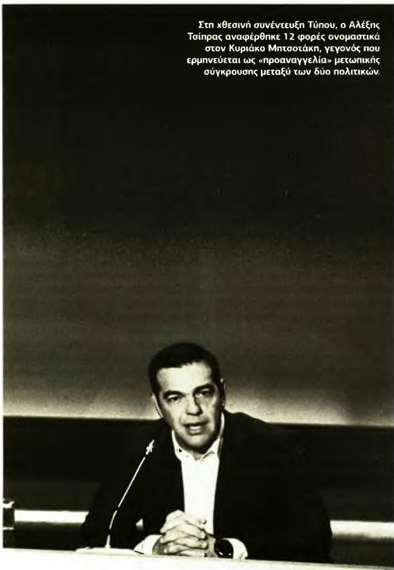
Στη χθεσινή συνέντευξη Τύπου, ο Αλέξης Τσίπρας αναφέρθηκε 12 φορές ονομαστικά στον Κυριάκο Μητσοτάκη, γεγονός που ερμηνεύεται ως «προαναγγελία» μετωπικής σύγκρουσης μεταξύ των δύο πολιτικών.