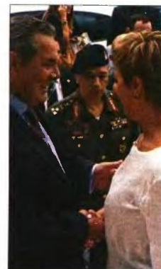
Ο Πάνος Καμμένος με την Ολγα Γεροβασίλη στην 83η ΔΕΘ

Ο κ. Καμμένος, απευθυνόμενος στον Αμερικανό πρόεδρο, είπε, μεταξύ άλλων, ότι οι Έλληνες δεν θα ξεχάσουν ποτέ ότι στα δύσκολα χρόνια της κρίσης οι Ηνωμένες Πολιτείες ήταν σύμμαχος και όχι δανειστής, γεγονός που, όπως επισήμανε, έστειλε ένα πολύ σημαντικό μήνυμα για την ελληνική οικονομία και το μέλλον της Ελλάδας. Ακόμα, αναφέρθηκε στις διαχρονικές σχέσεις φιλίας της Ελλάδας με τις ΗΠΑ στη διάρκεια των περασμένων δεκαετιών.