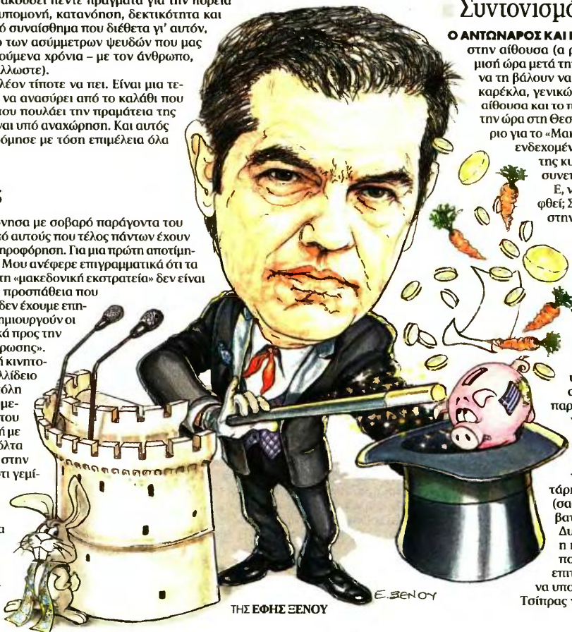
ΤΗ ΕΦΗΣ ΕΞΕΝΟΥ

Μα είναι δυνατόν να επιχειρεί έτσι ξεδιάντροπα να προσεταιριστεί τον Γιάννη Μπουτάρη, τον Σταύρο τον Αρναουτάκη της Κρήτης (σας τα έλεγα τα σχετικά με τον Σταύρο, το Σάββατο, εδώ) και τον Αποστόλη Κατσιφάρα (της Δυτικής Ελλάδας); Τέσσερα χρόνια τους έψπνε η κυβερνήσή του, το ψάρι στα χείλη, και τώρα που φτάσαμε στις εκλογές θυμήθηκε ότι και επιτυχημένοι είναι και ικανοί, και κυρίως άξιοι να υποστηριχθούν από τον ΣΥΡΙΖΑ στις εκλογές. Τσίπρας για πάντα. Και παντού.