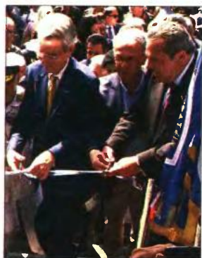
Ο υπ. Αμυνας Πάνος Καμμένος εγκαινιάζει τον περιπτερό των Ενόπλων Δυνάμεων με τον Αμερικανό πρόεδρο Τζέφρι Πάιτς

Ο ΡΟΛΟΣ των Ενόπλων Δυνάμεων αναδεικνύεται στην 83η Διεθνή Εκθεση Θεσσαλονίκης και η προσφορά τους στην ελληνική κοινωνία είναι δεδομένη σε κάθε περίπτωση, σημείωσε, μεταξύ άλλων, ο υπουργός Εθνικής Αμυνας Πάνος Καμμένος στα εγκαίνια του περιπτερό των Ενόπλων Δυνάμεων στη ΔΕΘ και συμπλήρωσε: «Ο Στρατός, η Αεροπορία, το Ναυτικό θα εγγυώνται την εθνική ανεξαρτησία και την κυριαρχία της χώρας, και είναι έτοιμοι να αντεπεξέλθουν σε οποιαδήποτε περίπτωση».