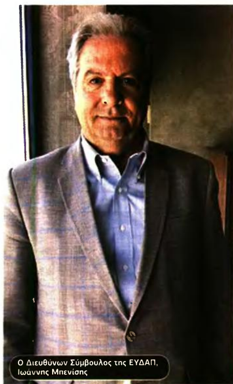
Ο Διευθύνων Σύμβουλος της ΕΥΔΑΠ, Ιωάννης Μπενίσης

Αναγνωρίζοντας, ωστόσο, τη δυσμενή οικονομική συγκυρία, εξαιτίας της οποίας κάποια νοικοκυριά αδυνατούν να πληρώσουν ακόμα και ένα χαμηλό λογαριασμό, όπως αυτόν της ΕΥ-