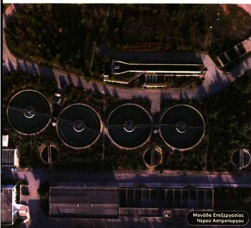
Μονάδα Επεξεργασίας Νερού Ασπροπυργού

συμπολίτης μας βρίσκεται αποδεδειγμένα σε οικονομική δυσχέρεια, δεν θα πρέπει να ανησυχεί όσον αφορά το νερό, γιατί δεν θα του το στερήσουμε.