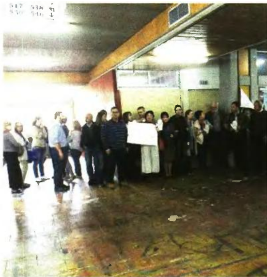
Πάνω, η «αλυσίδα» των διδασκόντων στην προσπάθειά τους να εμποδίσουν τη συγκέντρωση των μελών του Ρουβίκωνα στο «στέκι». Δεξιά, ο Ρουβίκωνας «ποζάρει» στο φακό του και μετά ανεβάζει φωτογραφίες στο Διαδίκτυο με τα «κατορθώματά» του.