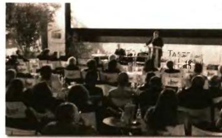
Στιγμιότυπο από την εκδήλωση που οργάνωσε η Επιτροπή Αγώνα Εργαζομένων ΕΥΔΑΠ

Ο εγκλωβισμός του κινήματος στην αναζήτηση της « λιγότερο επώδυνης διαχείρισης », μεταξύ των διαφόρων « εναλλακτικών μοντέλων », δηλαδή της πλήρους ιδιωτικοποίησης,