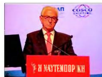
Ο Νίκος Φίλιππας, επιστημονικός υπεύθυνος του INTERAMERICAN Research Center, καθηγητής χρηματοοικονομικής του πανεπιστημίου Πειραιώς και πρόεδρος του ινστιτούτου χρηματοοικονομικού αλφαριθμητισμού.

Μία από τις σημαντικότερες προκλήσεις των δυτικών κοινωνιών είναι η υπογεννητικότητα, τα χαμηλά επιτόκια των τελευταίων ετών που επηρεάζουν τις αποδόσεις των ασφαλιστικών ταμείων και το ύψος της περιουσίας τους και τα δη-