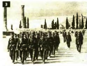
3. Επιστρατοί, ορισμένοι πολύτεκνοι, σε ασκήσεις στους Στύλους του Ολυμπίου Διός την περιοχή των Βαλκανικών Πολέμων 4. Παιδιά επιστρατών πολύτεκνων που αρχισαν να παίρνουν για πρώτη φορά επιδόματα 5. Διαδηλώσεις πολύτεκνων, με πινακιά που τα ήνεε όλα

Κάποτε όμως έρχεται η αρχή και η αφορμή δόθηκε στους Βαλκανικούς Πολέμους 1912-13 από ένα τυχαίο γεγονός που έπεσε στην αντίληψη του τότε αρχιστρατήγου διαδόχου Κωνσταντίνου , όταν οι επιστρατοί έκαναν στους