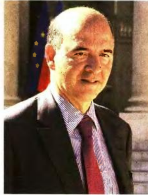
Γελοία χαρακτηρίσε την πρόταση του ΔΝΤ για την ελάφρυνση του ελληνικού χρέους ο Τ. Βίτσερ. Υπέρ της συμφωνίας για τη δόση τάχθηκε ο Π. Μοσκοβισί.

του EWG κ. Τόμας Βίτσερ σε συνέντευξη στην αυστριακή εφημερίδα «Salzburger Nachrichten».