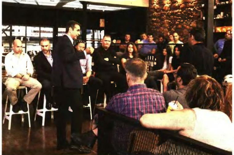
► ΣΥΝΑΝΤΗΣΗ Κ. ΜΗΤΣΟΤΑΚΗ ΜΕ ΔΙΑΝΟΜΕΙΣ ΦΑΓΗΤΟΥ ΚΑΙ ΦΥΛΑΚΕΣ

«Είναι μια πραγματικότητα που δεν μπορεί να γίνει αποδεκτή σε μια σύγχρονη, ευνομούμενη κοινωνία. Δεν συνάδει με τον τρόπο που αντιλαμβάνομαι την αγορά εργασίας», είπε ο πρόεδρος της Ν.Δ. σχετικά με τις συνθήκες εργασίας που επικρατούν στο χώρο των διανομέων.