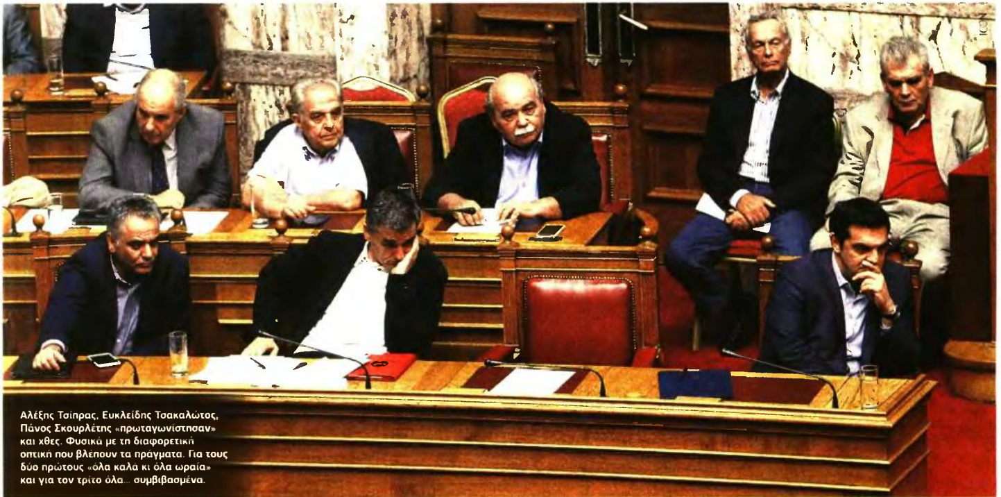
Αλέξης Τσίπρας, Ευκλείδης Τσακαλώτος, Πάνος Σκουρλέτης «πρωταγωνίστησαν» και «χτες». Φυσικά με τη διαφορετική οπτική που βλέπουν τα πράγματα. Για τους δύο πρώτους «όλα καλά κι όλα ωραία» και για τον τρίτο όλα... συμβιβασμένα.

ΟΜΟΛΟΓΙΑ ΣΚΟΥΡΛΕΤΗ ΤΗΝ ΩΡΑ ΠΟΥ Η ΚΥΒΕΡΝΗΣΗ ΜΙΛΑΕΙ ΓΙΑ ΔΙΑΦΑΙΝΟΜΕΝΗ ΑΝΑΠΤΥΞΗ!