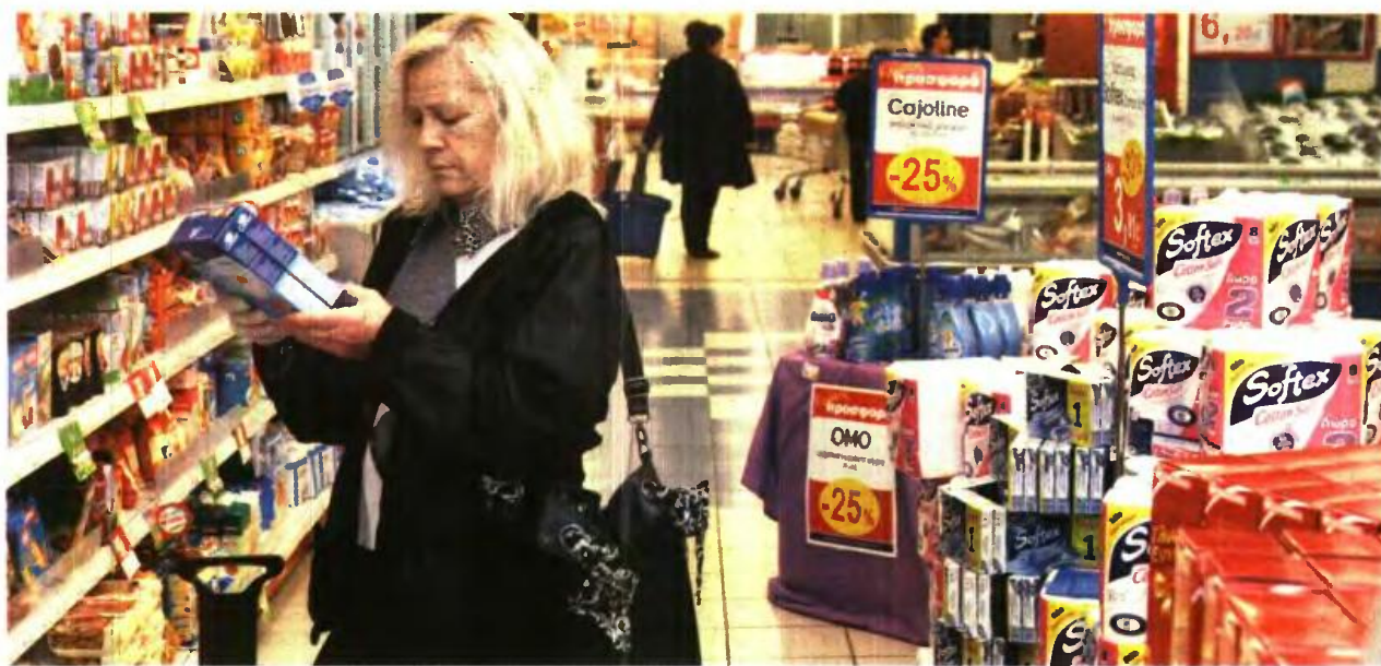
ΕΠΙΒΑΡΥΝΣΕΙΣ στους οικογενειακούς προϋπολογισμούς θα φέρει η αύξηση του ανώτατου συντελεστή ΦΠΑ από το 23% στο 24%

Με την αναπροσαρμογή του συντελεστή εκτιμάται πως θα εισπραχθούν 400-500 εκατ. ευρώ επιπλέον έσοδα. Ανοιχτός παραμένει ο χρόνος εφαρμογής του μέτρου