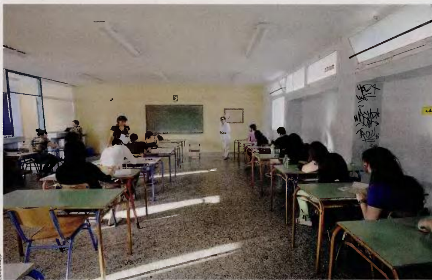
Ο σύλλογος διδασκόντων του ιδιωτικού σχολείου θα κάνει μόνο τον χαρακτηρισμό φοίτησης των μαθητών, δηλαδή τον έλεγχο απουσιών αλλά και της διαγωγής των μαθητών.

Καθηγητές δημοσίων σχολείων θα «βγάλουν» τα θέματα και θα επιτηρούν τις απολυτήριες εξετάσεις στα ιδιωτικά σχολεία. Σύμφωνα με πληροφορίες, ο υπουργός Παιδείας Νίκος Φίλης θα προχωρήσει στην έκδοση υπουργικής απόφασης στην οποία θα ορίζεται ότι στις απολυτήριες γραπτές εξετάσεις της Γ' Γυμνασίου και της Γ' Λυκείου τα θέματα σε κάθε μάθημα θα τα επιλέγουν δύο καθηγητές δημοσίου σχολείου, οι οποίοι επίσης θα βαθμολογούν τα γραπτά και θα έχουν την ευθύνη της έκδοσης των απολυτηρίων. Οσο για τον σύλλογο διδασκόντων του ιδιωτικού σχολείου, θα κάνει μόνο τον χαρακτηρισμό φοίτησης των