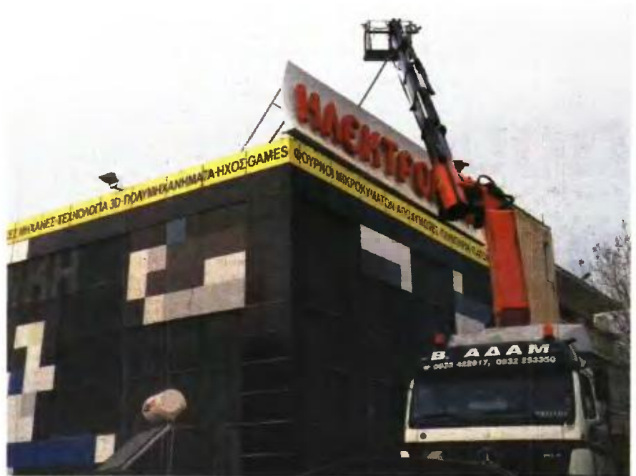
ΣΥΝΕΡΓΕΙΟ κατεβάζει την ταμπέλα της «Ηλεκτρονικής» στο κατάστημα της Παιανίας

διοίκηση, το επιχειρηματικό πλάνο, το οποίο συναποφασίστηκε από τις τράπεζες, τους προμηθευτές και τους μετόχους τον Απρίλιο του 2015, είχε δημιουργήσει βάσιμες προοπτικές για την ανάκαμψη της εταιρείας. Όσα συνέβησαν, από τον Ιούνιο του 2015 και μετά, υπονόμησαν και στη συνέχεια ακύρωσαν στην πράξη οποιονδήποτε σχεδιασμό.