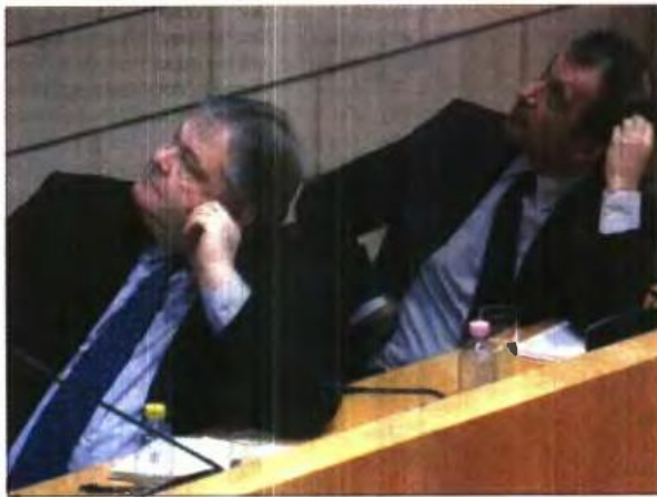
Με το βλέμμα στραμμένο αλλού ο Ευάγγελος Βενιζέλος και ο καθηγητής του Paris School of Economics Ντανιέλ Κοέν στην προχθεσινή εκδήλωση για το PSI

Δεν πρέπει να ξεχνάμε ότι οι άνθρωποι αυτοί έχουν υποφέρει και έχουν χάσει από την κρίση όσα και όλοι οι υπόλοιποι, αλλά επιπλέον έχουν υποστεί και τη δόλια δήμευση των αποταμιεύσεών τους. Πώς είναι, λοιπόν, δυνατόν ένα κράτος το οποίο θέλει να λέγεται ηθικό και δίκαιο να τους ζητά να πληρώσουν κανονικά τις φορολογικές και λοιπές υποχρεώσεις τους, χωρίς να συμβαίνει απολύτως τίποτα; Πώς είναι ποτέ δυνατόν να μην τους αναγνωρίζει τη ζη-