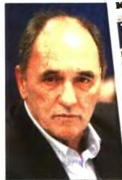
Ο Γ. Σταθάκης και το πρωτοσέλιδο της «κυριακάτικης δημοκρατίας» στις 22 Σεπτεμβρίου 2013