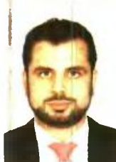
Γράφει ο Διονύσιος Ρίζος

Σε τροχιά υλοποίησης τίθενται τα σχέδια της κυβέρνησης για το νέο Ασφαλιστικό, καθώς, σύμφωνα με τις εξαγγελίες του υπουργού Εργασίας, άμεσα θα σχηματιστούν τα νομοθετικά κείμενα ώστε να είναι έτοιμα προς κατάθεση στη Βουλή. Η τελική τους διαμόρφωση θα εξαρτηθεί από τα τελικά στάδια διαπραγμάτευσης και ως τότε θα μπαίνουν οι τελικές «πινελιές» που θα διαμορφώσουν και το νέο σκηνικό στην κοινωνική ασφάλιση. Οι νέες ρυθμίσεις αφορούν τον νέο τρόπο υπολογισμού των συντάξεων, χωρίς όμως να γίνεται διευκρίνιση για το ποια θα είναι (τουλάχιστον σε πρώτη φάση) η βάση υπολογισμού των νέων συντάξεων, αν δηλαδή θα