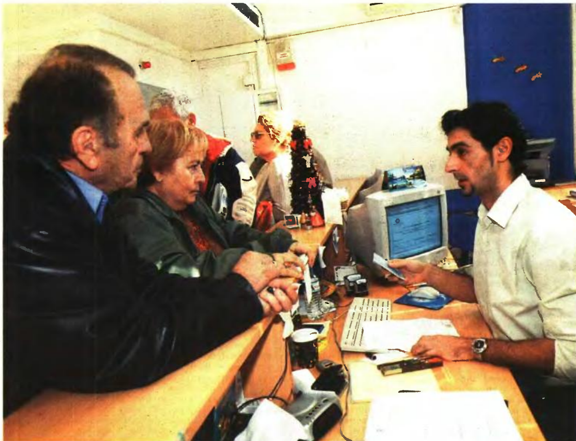
Εκτός κινδύνου είναι όσοι ασφαλισμένοι πρόλαβαν να θεμελιώσουν δικαίωμα συνταξιοδότησης μέχρι τις 18 Αυγούστου 2015

Ενδεικτικά δημοσιεύονται πέντε παραδείγματα για τις επιπτώσεις που έχουν οι αλλαγές σε