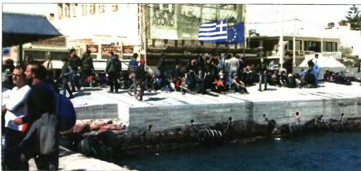
Πρόσφυγες και μετανάστες στο λιμάνι της Χίου

Μ πόνους» στους δικαιούχους Κοινωνικού Τουρισμού που θα επιλέξουν για τις καλοκαιρινές διακοπές τους τη Λέσβο, τη Χίο, τη Σάμο, τη Λέρο και την Κω, που σπκώνουν το μεγαλύτερο βάρος της διαχείρισης του Προσφυγικού, αποφάσισε να δώσει η κυβέρνηση.