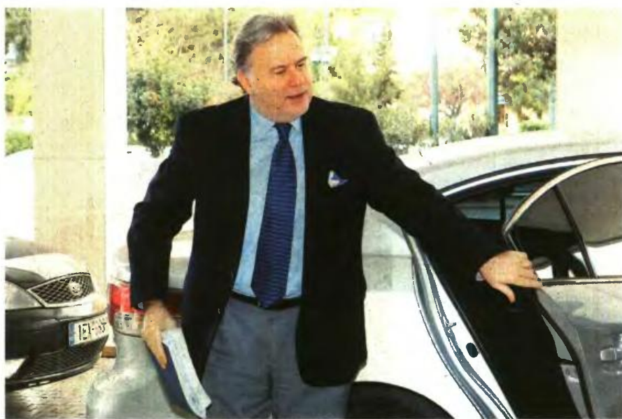
Το ζήτημα του συντελεστή αναπλήρωσης στις επικουρικές συντάξεις είναι ζωτικής σημασίας για τον υπουργό Εργασίας Γιώργο Κατρούγκαλο

Για παράδειγμα, αν ένας συνταξιούχος εισπράττει από κύρια και επικουρική σύνταξη 1.500 ευρώ μεικτά και με τον επανυπολογισμό η επικουρική του πεσει από τα 300 στα 150 ευρώ, θα χάσει 150 ευρώ και θα πέσει στα 1.350 ευρώ. Αντίστοιχα, αν ένας συνταξιούχος εισπράττει σήμερα 950 ευρώ από κύρια και 250 από επικουρική (άθροισμα 1.200 ευρώ μεικτά) και μετά τον επανυπολογισμό η επικουρική πέφτει στα