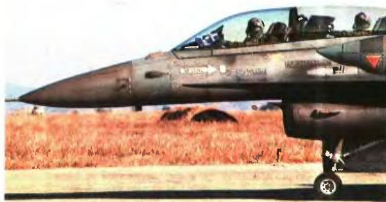
Το ποσοστό επιτυχίας στη Σχολή Ικάρων - Ιπτάμενοι ανέρχεται σε 12,50%