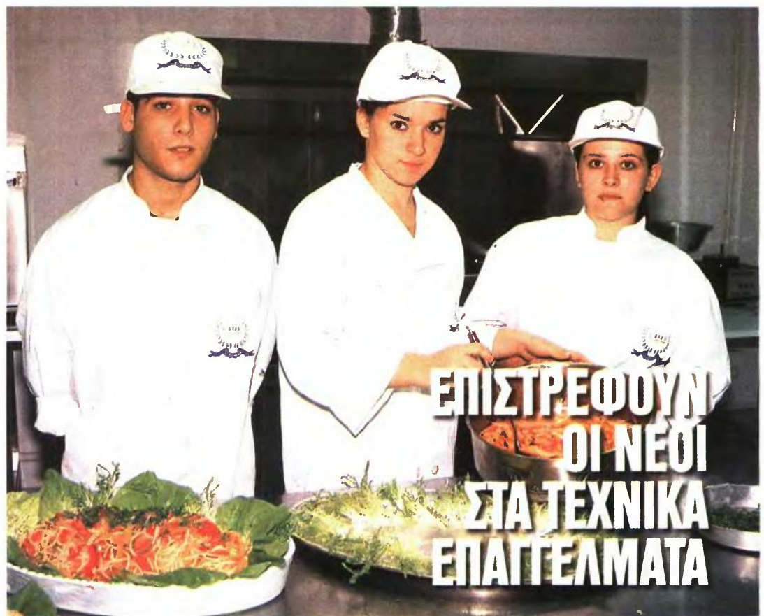
Ανεργία και οικονομική κρίση στρέφουν τους νέους στα Ινστιτούτα Επαγγελματικής Κατάρτισης, σε μια προσπάθεια να αποκτήσουν κάποια ειδικότητα που θα τους βοηθήσει να εργαστούν άμεσα. • Σελ. 6-7