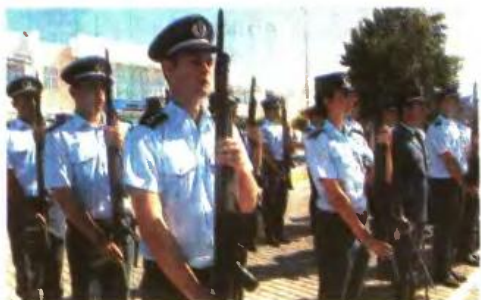
Ελληνική ιθαγένεια, υγεία και άρτια σωματική διάπλαση μεταξύ των προσόντων για τις Στρατιωτικές Σχολές

Τέλος, πρέπει να επισημανθεί ότι σε περίπτωση κατά την οποία υποψήφιος/-α, μετά την επιτυχία και την κατάταξή του/της σε ΑΣΕΙ - ΑΣΣΥ, αρνείται την εκτέλεση των στρατιωτικών του/της καθηκόντων λόγω θρησκευτικών ή άλλων δοξασιών και πεποιθήσεων, εφαρμογής τυγχάνουν οι σχετικές διατάξεις των Κανονισμών Οργάνωσης και Λειτουργίας των Σχολών.