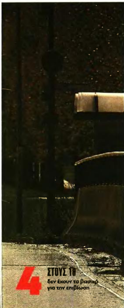
4 ΣΤΟΥΣ 10 δεν έχουν τα βασικά για την επιβίωση