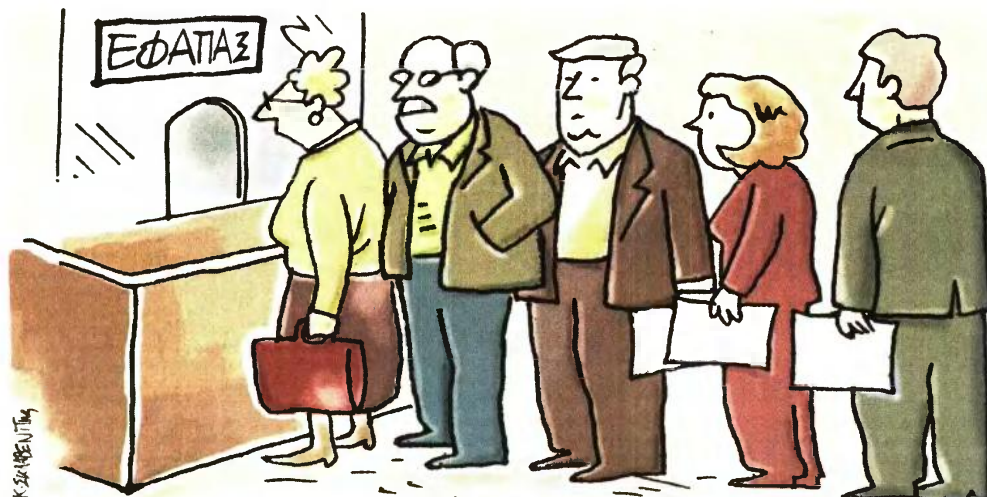
ΕΙΚΟΝΟΓΡΑΦΗΣΗ ΚΩΣΤΑΣ ΣΚΛΑΒΕΝΙΤΗΣ

Σε αναμονή βρίσκονται περίπου 280.000 αιτήσεις για κύριες και επικουρικές συντάξεις!