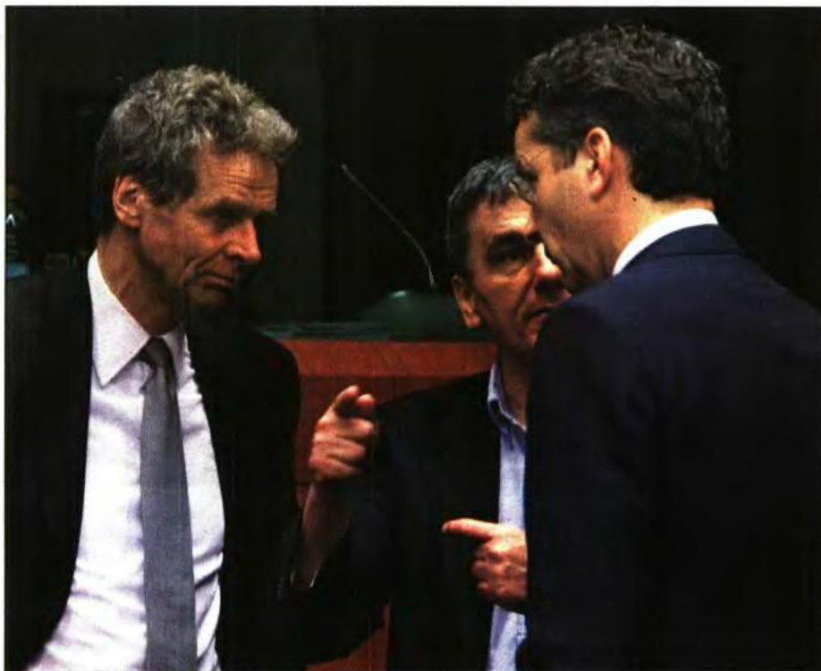
Ο Ευκλείδης Τσακαλώτος με τον Γερσόν Ντάσσελμπλουμ και τον Πολ Τόμσον σε παλαιότερο Ευρογρουπ

Επίσης θέλει την πλήρη απαλλαγή από τον φόρο για όσους σήμερα έχουν έκπτωση 50% (ετήσιο εισόδημα έως 9.000 σε συνδυασμό με χαμηλή ακίνητη περιουσία).