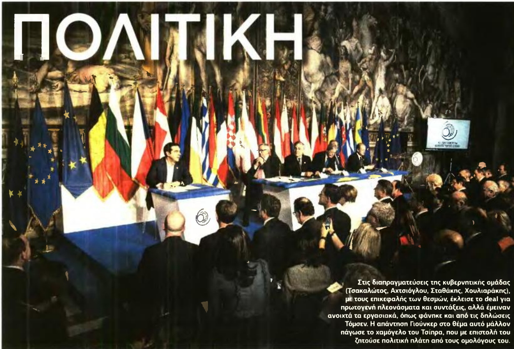
Στις διαπραγματεύσεις της κυβερνητικής ομάδας (Τσακαλώτος, Αχτσιόγλου, Σταθάκης, Χουλιαράκης), με τους επικεφαλής των θεσμών, έκλεισε το deal για πρωταγενή πλεονάσματα και συντάξεις, αλλά έμειναν ανοικτά τα εργασιακά, όπως φάνηκε και από τις δηλώσεις Τόμσεν. Η απάντηση Γιούνκερ στο θέμα αυτό μάλλον πάγωσε το χαμόγελο του Τσίπρα, που με επιστολή του ζήτησε πολιτική πλάτη από τους ομολόγους του.