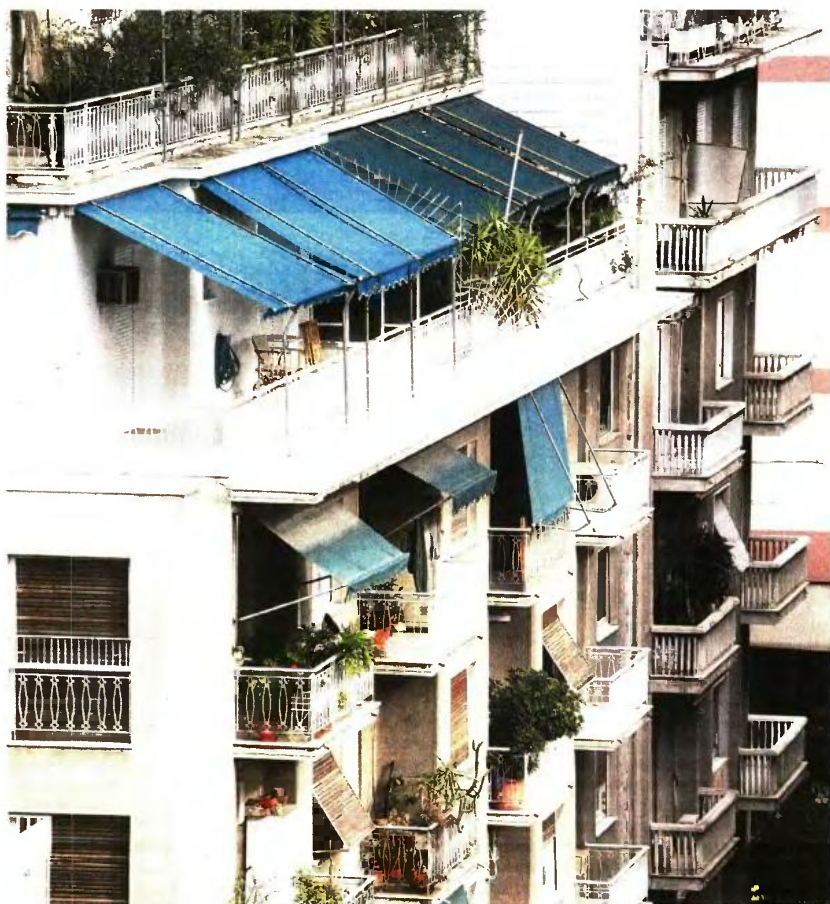
Μονόδρομος για την κυβέρνηση μετά την απόφαση του ΣτΕ η άμεση νομοθέτηση για τη Μεταφορά Συντελεστή Δόμησης, καθώς ανοίγει ο δρόμος για αξιώσεις και άλλων ιδιοκτητών.

Επειτα, το ΥΠΕΧΩΔΕ εξέδωσε εγκύκλιο με την οποία αναστάλη γενικά η εφαρμογή των διατάξεων για τη ΜΣΔ, όπως αναστάλη και η «εκτέλεση των τίτλων ΜΣΔ οι οποίοι είχαν ήδη εκδοθεί, προκειμένου να συνταχθεί νέο θεσμικό πλαίσιο εναρμονισμένο προς τις συνταγματικές επιταγές, όπως αυτές καθορίστηκαν από την απόφαση του ΣτΕ». Αυτό είχε ως αποτέλεσμα να μηδενιστεί η αξία