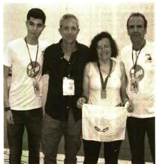
Η αθλήτρια από την Κύπρο μετά την περηνή της συμμετοχή

Ο αγώνας προσελκύει εκατοντάδες αθλητές από όλη την Ελλάδα που θα έρθουν στον Βόλο και τη Μαγνησία με τις οικογένειές τους, με συνέπεια ο 4ος Ημιμαραθώνιος Βόλου να αποτελεί τη