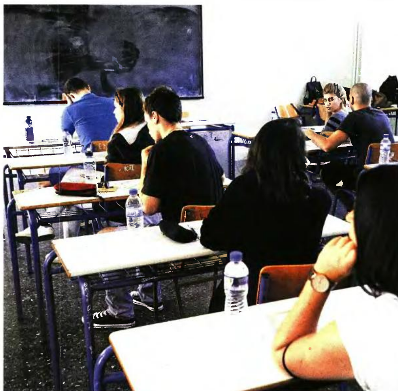
Οι υποψήφιοι, ασχέτως με το σε ποιο μάθημα θα ασθενήσουν, στην περίπτωση που επιθυμούν συμμετοχή στις επαναληπτικές εξετάσεις θα πρέπει να εξεταστούν από την αρχή σε όλα τα πανελλαδικώς εξεταζόμενα μαθήματα που έχουν δηλώσει.

Α νοικτό παραμένει το θέμα του αριθμού εισακτέων, καθώς το υπουργείο Παιδείας δεν έχει ανακοινώσει ακόμα ούτε θα εκδοθεί η νέα υπουργική απόφαση με τον περιορισμό της μείωσης κατά το ήμισυ. Παράλληλα, προσπαθεί να κλείσει το μέτωπο των επαναληπτικών Πανελλαδικών, δυσκολεύοντας σε μεγάλο βαθμό τους υποψηφίους, ώστε να τους αποτρέψει το «δωράκι» των δύομισι μηνών επιπλέον διαβάσματος που τους δίνει η νέα ημερομηνία διεξαγωγής τους τον Σεπτέμβρη.