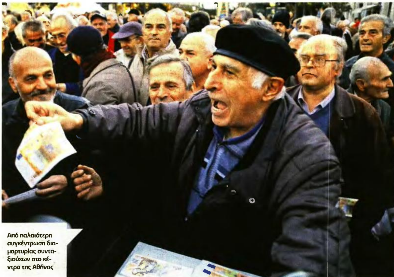
Από παλαιότερη συγκέντρωση διαμαρτυρίας συνταξιούχων στο κέντρο της Αθήνας