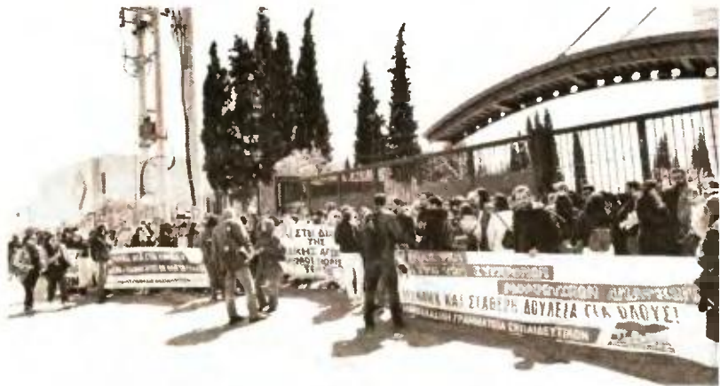
Από αντίστοιχη κινητοποίηση εκπαιδευτικών στο υπουργείο την περασμένη βδομάδα

« Πρόκειται στην ουσία για καθορισμό κριτηρίων για την απόλυση αναπληρωτών κι όχι προσλήψεων! » τονίζει η Πανελλαδική Γραμματεία Εκπαιδευτικών του ΠΑΜΕ , επαναλαμβάνοντας πως είναι επιτακτική η ανάγκη για μαζικούς, μόνιμους διορισμούς και καλώντας ΕΑΜΕ και συλλόγους να οργανώσουν την πάλη. «Αυτό το αίτημα μπορεί και πρέπει να ενώσει τους πάντες!», τονίζει και αναφέρεται στις ανατροπές στον τρόπο πρόσληψης που φέρνει η Υπουργική Απόφαση, σημειώνοντας ότι: «Απαξιώνεται το βασικό πτυχίο στην Ειδική Αγωγή (5 μονάδες) και εξομοιώνεται σχεδόν με το μεταπτυχιακό (4 μονάδες) ή το διδακτορικό (6 μονάδες). Αξιώνεται η προϋπηρεσία (0,25 ανά μήνα). Θεσπίζονται σειρά κοινωνικών κριτηρίων, όπως η πολυτεκνία, που αλλάζουν άρδην τη σειρά κατάταξης. Πρόκειται για αλλαγές στην ίδια κατεύθυνση με αυτές που επιχειρήσε να περάσει ο προηγούμενος υπουργός Παιδείας το καλοκαίρι και σταμάτησαν κάτω από το βάρος των κινητοποιήσεων».