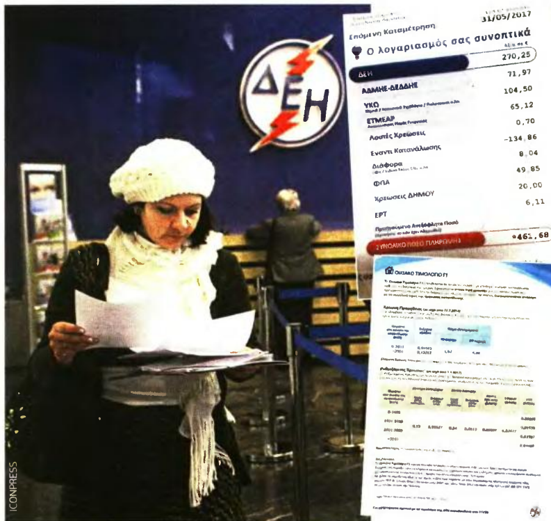
Νοικοκυρίο που κατανάλωσε ρεύμα αξίας 270 ευρώ θα επιβαρυνθεί και με 104 ευρώ για την κοινωνική πολιτική του κράτους, καθώς και με 65 ευρώ για το ΕΤΜΕΑΡ και τελικά π... Λυπητήρ θα ανέλθει σε 461 ευρώ.

βατώρες το τετράμηνο. Για εκείνους που ξεπεράσουν το όριο, η χρέωση μπορεί να φτάσει από 0,20645 έως 0,209745 ευρώ. Μιλάμε δηλαδή για μια τεράστια αύξηση, η οποία έχει φέρει τους καταναλωτές προ τετραεσμένων γεγονότων.