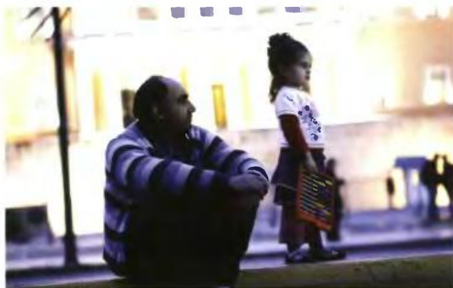
Οι οικογενειακές πολιτικές διεθνώς στηρίζονται στο τρίπτυχο: γονικές άδειες, προσχολική αγωγή και συμφιλίωση επαγγελματικής και οικογενειακής ζωής.