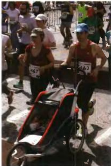
Στην Ελλάδα, η οικογένεια έχει καταντήσει να είναι μία καθαρά ιδιωτική υπόθεση.