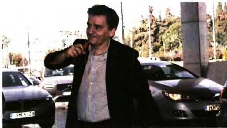
Οι διαβουλεύσεις κυβέρνησης και θεσμών ήταν πολύωρες καθ' όλη τη διάρκεια του Σαββατοκύριακου (φωτογραφία αρχείου).

Σύμφωνα με υψηλόβαθμη κυβερνητική πηγή, πριν από τη χθεσινή μαραθώνα συνάν-