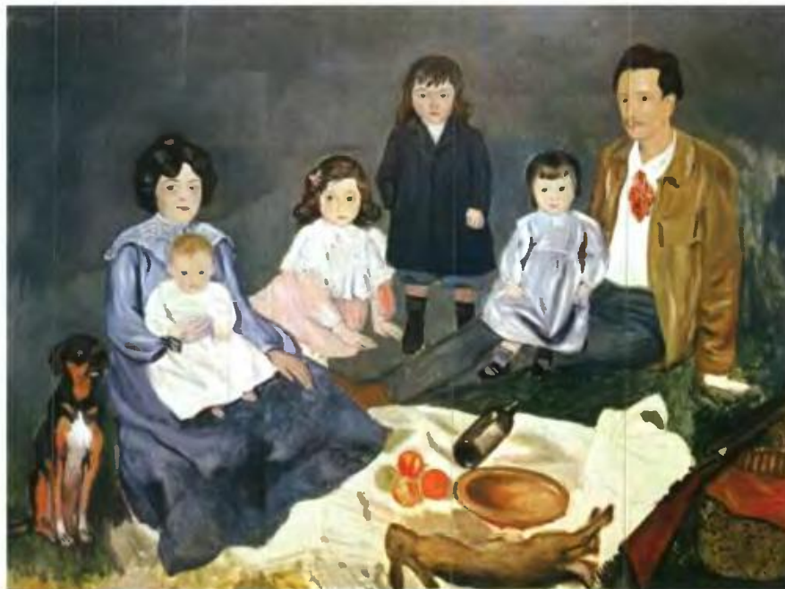
«Το προγευμα στη χλόη της οικογένειας Σολέρ». Έργο του Πάμπλο Γικάσο (1903). Μουσείο Σύγχρονης Τέχνης, Λιέγη

Τη στιγμή που όλο και περισσότερες χώρες εφαρμόζουν ολοκληρωμένες στρατηγικές για τη στήριξή της, οι πολιτικές για την οικογένεια στην Ελλάδα παραμένουν άκρως ελλειμματικές.