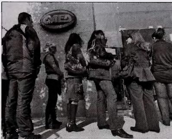
Από τον πληθυσμό που παλεύει με τη φτώχεια, το 68,5% είναι άνεργοι και το 20,6% αυτοαπασχολούμενοι, το 2,9% συνταξιούχοι ενώ μόνο το 0,6% είναι υπάλληλοι σε δημόσιο ή τράπεζες

Ενδιαφέρον παρουσιάζει η εξέλιξη της ακραίας φτώχειας για διαφορετικές ομάδες του πληθυσμού, π.χ. ανά δημογραφική κατηγορία. Πράγματι, ιδιαίτερη εντύπωση προκαλεί το πολύ υψηλό ποσοστό ακραίας φτώχειας των νέων ηλικίας 18-29 ετών (22,6% το 2016), καθώς και το πολύ χαμηλό ποσοστό των ηλικιωμένων (2,4%). Επίσης, ενώ το 2011 οι άνδρες σημείωναν χαμηλότερα ποσοστά ακραίας φτώχειας από ό,τι οι γυναίκες (8,7% έναντι 9,2%), από το 2012 και μετά ισχύει το αντίθετο (14% έναντι 13,2% το 2016). Η έρευνα δείχνει ότι τα νοικοκυριά χωρίς παιδιά πράγματι αντιμετωπίζουν χαμηλότερα ποσοστά ακραίας φτώχειας από ό,τι οι οικογένειες με παιδιά (11,5% έναντι 16,4% το 2016). Όμως, οι οικογένειες με τρία παιδιά φαίνεται να βρίσκονται σε καλύτερη θέση (12,5%) από ό,τι εκείνες με ένα (18,7%) ή δύο (15,1%) παιδιά, ενώ οι οικογένειες με τέσσερα ή περισσότερα παιδιά καταγράφουν τα υψηλότερα ποσοστά ακραίας φτώχειας (22,1%).