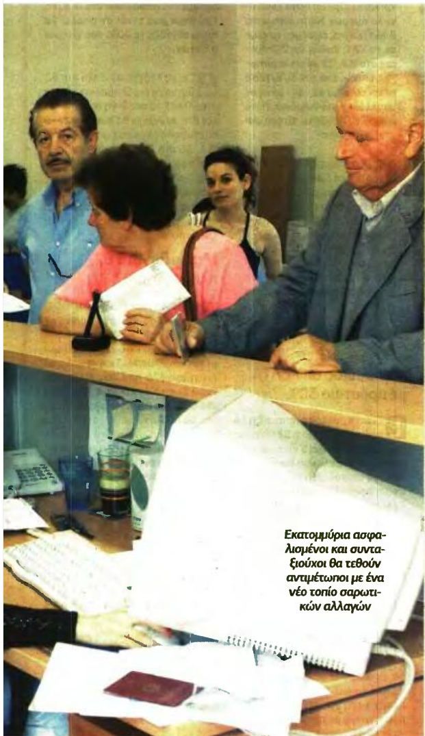
Εκατομμύρια ασφαλισμένοι και συνταξιούχοι θα τεθούν αντιμετώπιση με ένα νέο τοπίο σαρωτικών αλλαγών