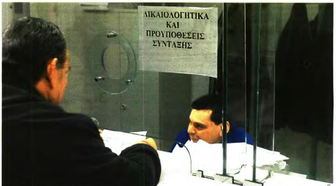
Μετά τις τελευταίες αλλαγές, ο υπολογισμός του ποσού προσωρινής σύνταξης θα γίνεται με βάση τον μέσο όρο των συντάξιμων αποδοκών των 12 τελευταίων μηνών που προηγούνται του αιτήματος συνταξιοδότησης των ασφαλισμένων και ανέρχεται στο 50% του ποσού αυτού

Να σημειωθεί πως με βάση τη νομοθεσία οι ασφαλισμένοι που υποβάλλουν τα χαρτά τους για να πάρουν σύνταξη δικαιούνται -μέχρι να εκδοθεί η τελική απόφαση- να πάρουν προσωρινή σύνταξη.