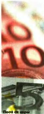
Ποσά σε ευρώ

Ο νόμος που ψηφίστηκε ορίζει ότι οι αλλαγές στη μηνιαία παρακράτηση της ειδικής εισφοράς αλληλεγγύης θα πρέπει να εφαρμοστούν από την έναρξη ισχύος των νέων διατάξεων. Επειδή είναι σύνθηρες σε τέτοιες περιπτώσεις