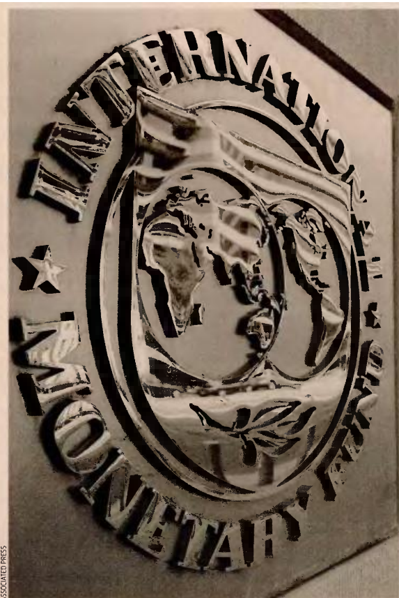
Οι θεσμοί και κυρίως το Διεθνές Νομισματικό Ταμείο είναι αντίθετοι στη θεσμοθέτηση ευνοϊκών διατάξεων για φοροφυγάδες.

Η θέση αυτή σχετικά με την αναβολή στη δημιουργία του περιουσιολογίου μοιάζει προοπτική, καθώς με το περιουσιολόγιο καλούνται όλοι οι Έλληνες φορολογούμενοι να δηλώσουν το σύνολο των περιουσιακών τους