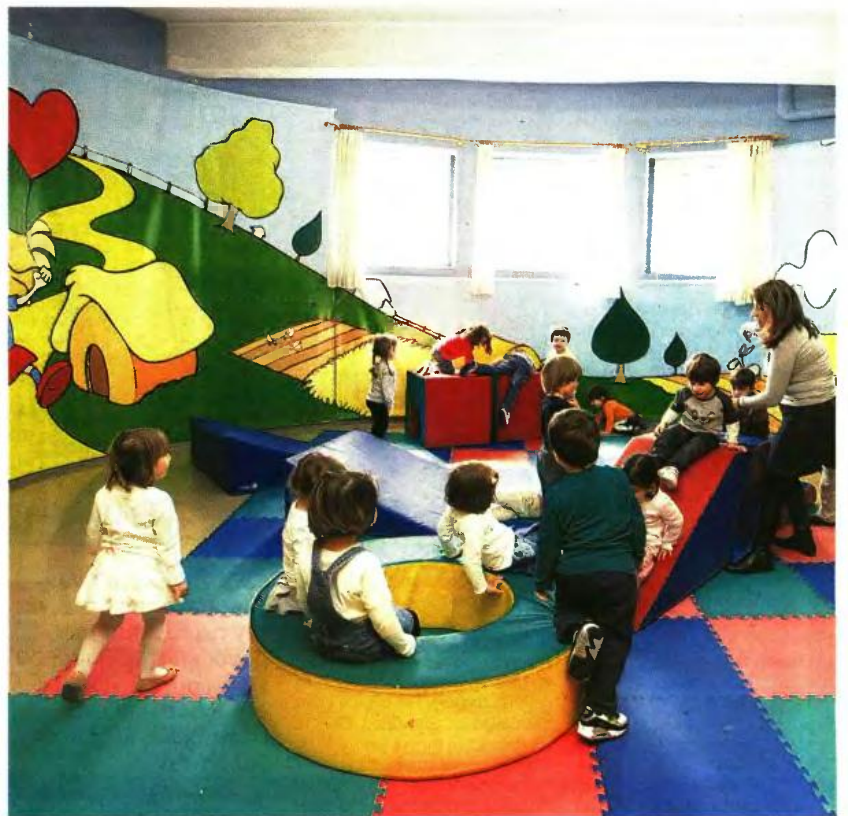
Περίπου 2.886 δομές θα φιλοξενήσουν παιδιά φέτος. Η συνολική δαπάνη του προγράμματος για φέτος είναι 175 εκατ. ευρώ, από τα οποία τα 100 εκατ. ευρώ θα δοθούν σε όσους βρίσκονται στα όρια της φτώχειας.

Βασικός στόχος αλλαγών είναι να διευρυνθεί το ποσοστό των παιδιών που προέρχονται από οικογένειες που «βρίσκονται κάτω από το κατώφλι της φτώχειας», όπως σημειώθηκε από τους αρμόδιους υπουργούς, χωρίς να δίνεται ο ακριβής αριθμός των οικογενειών που υπάγονται σε αυτή την κατηγορία. Σύμφωνα με τον ειδικό γραμματέα των Επιχει-