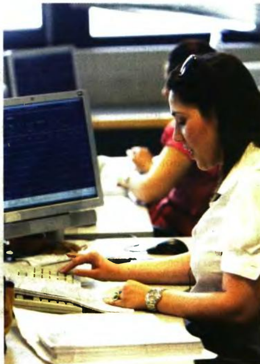
ΕΞΑΙΡΕΣΕΙΣ ΑΠΟ ΤΟ ΜΕΤΡΟ της αναγκαστικής είσπραξης προβλέπει η νομοθεσία

Οι κατασχέσεις των παραπάνω ποσών επιτρέπεται να γίνονται πριν από την καταβολή τους στους δικαιούχους οφειλέτες του Δημοσίου, δηλαδή ενώ τα ποσά αυτά βρίσκονται ακόμη στα χέρια εκείνων που πρόκειται να τα καταβάλουν (στα χέρια τρίτων, δηλαδή στα χέρια των εργοδοτών αν πρόκειται για μι-