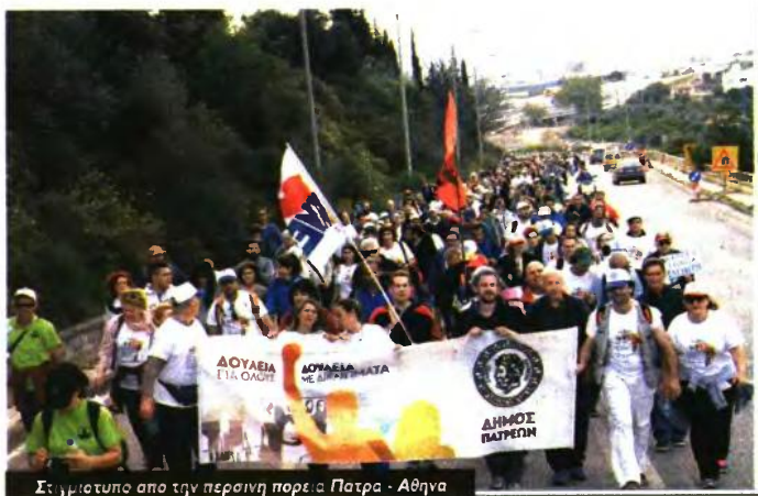
Σε φωτοτυπο από την περσινή πορεία Πάτρα - Αθήνα

Ενδεικτικά, ο δήμαρχος ανέφερε ορισμένα από αυτά: «Προχωρήσαμε σε μέτρα απαλλαγής και μείωσης των δημοτικών τελών και των τιμολογίων της ΔΕΥΑΠ για τις οικογένειες των ανέργων και απόρων, των πολιτικών και τρίτεκνων, των μονογονεϊκών οικογενειών, των α-