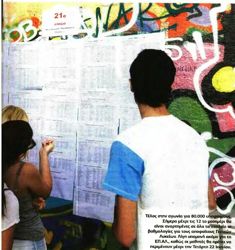
Τέλος στην αγωνία για 80.000 υποψηφίους. Σήμερα μέχρι τις 12 το μεσημέρι θα είναι αναρτημένες σε όλα τα σχολεία οι βαθμολογίες για τους αποφοίτους Γενικών Λυκείων. Λίγη υπομονή ακόμα για τα ΕΠ.ΑΛ., καθώς οι μαθητές θα πρέπει να περιμένουν μέχρι την Τετάρτη 22 Ιουνίου.