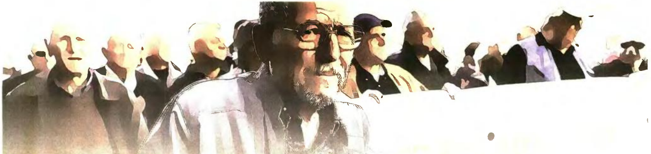
ΤΑ ΟΡΙΑ ΗΛΙΚΙΑΣ ΓΙΑ ΣΥΝΤΑΞΗ ΣΤΑ 62 ΜΕ 40 ΕΤΗ ΑΣΦΑΛΙΣΗΣ

Και τα ποσοστά αναπλήρωσης είναι εις βάρος των υψηλών αποδοχών... Το νέο ασφαλιστικό ημάρει όσους έχουν υψηλές εισφορές, ισοπεδώνει τους νέους, εξαθλιώνει τους πολλούς! Έχει συνταγματικά προβλήματα και είναι περισσότερο φορολογικός νόμος.