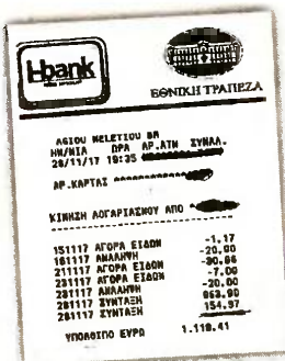
Το ποσό το οποίο επεισιτάφη ήταν 154,97 ευρώ ενώ θα έπρεπε να είναι περίπου 198 ευρώ

συνταξιούχους του Δημοσίου από την Ειδική Εισφορά Αλληλεγγύης, η οποία είχε κρατήσεις 4% υπέρ ΕΟΠΥΥ. Στο μεταξύ, δεν επιστράφηκαν εισφορές υγείας και σε περίπου 110.000 συνταξιούχους όλων των Ταμείων που: • υπέβαλαν αίτηση πριν από τις 12/5/2016 και συνταξιοδοτήθηκαν πρόσφατα, παίρνοντας οριστική σύνταξη και αναδρομικά. Για αυτές τις περιπτώσεις τα Ταμεία δεν έστειλαν έγκαιρα στην ΗΔΙΚΑ τα στοιχεία με τις επι-