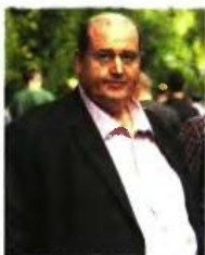
ΝΙΚΟΣ ΦΙΛΗΣ ΒΟΥΛΕΥΤΗΣ ΣΥΡΙΖΑ

“ Χρειάζεται να πάρουμε νομικά μέτρα -νομοθετικές προϋποθέσεις που χρειάζονται- ώστε να μην πάρει η μπάλα τον κόσμο της λαϊκής κατοικίας