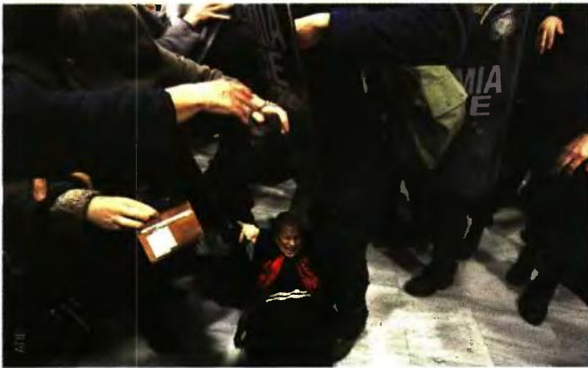
Κλοστές, κλοπες, χημικά μέσα σε αίθουσα Ειρηνοδικείου. Και η Ιστορία έγραψε: Νοέμβριος 2017, Ελλάδα, διακυβέρνηση ΣΥΡΙΖΑ...