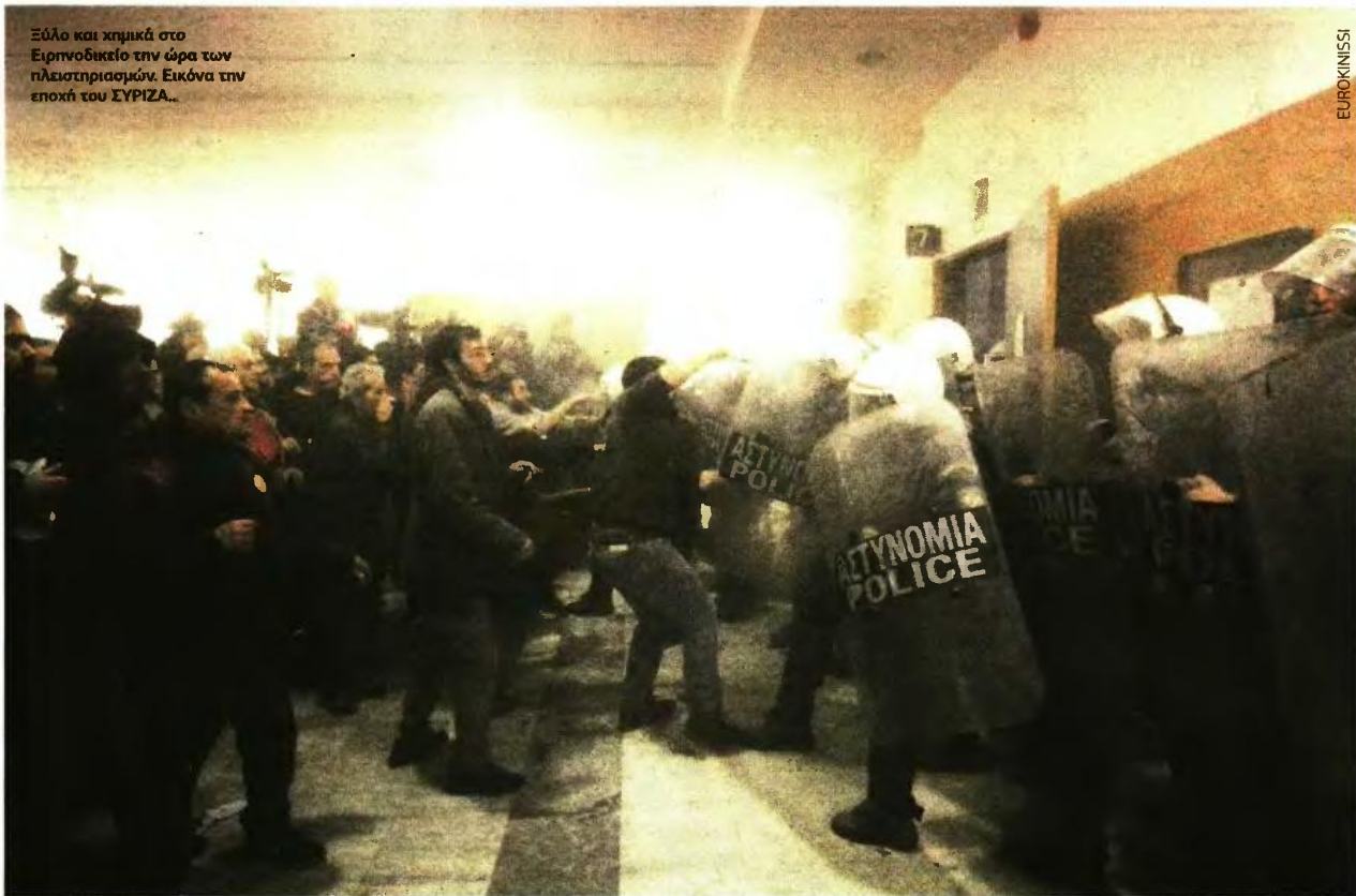
Ξόλο και χημικά στο Ειρηνοδικείο την ώρα των πλειστηριασμών. Εικόνα την εποχή του ΣΥΡΙΖΑ...