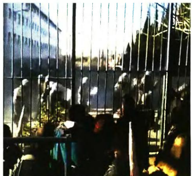
Φωτογραφία από τη χθεσινή διαμαρτυρία των φοιτητών που διαμένουν σε εστίες έξω από το υπουργείο Παιδείας, η οποία κατέληξε σε άγρια επεισόδια με χημικά από τα ΜΑΤ.

λέσματα του διαγωνισμού 2015 ήταν απογοητευτικά για τις επιδόσεις των Ελλήνων μαθητών, οι οποίοι βρέθηκαν πολύ χαμηλά στο μέσο όρο των χωρών που συμμετείχαν.