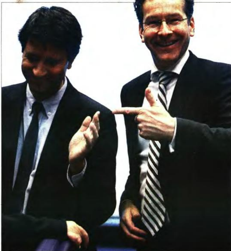
Ο αναπληρωτής υπουργός Οικονομικών Γιώργος Χουλιαράκης με τον απερχόμενο επικεφαλής του Eurogroup, Γερόνυμο Ντάσελμτλου

«Μεταρρύθμιση του συστήματος οικογενειακών παροχών από