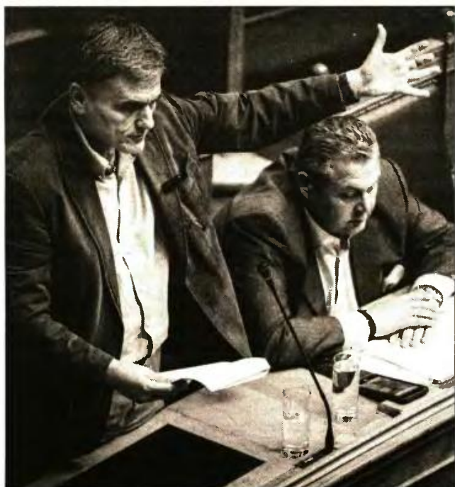
Ο υπουργός Οικονομικών Ευκλείδης Τσακαλώτος με τον υπουργό Εθνικής Αμυνας Πάνο Καμμένο