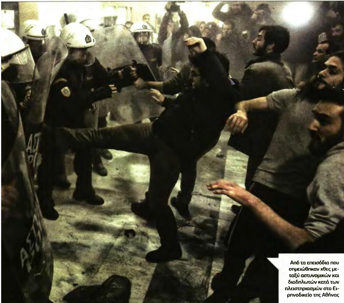
Από τα επεισόδια που σημειώθηκαν χθες μεταξύ αστυνομικών και διαδηλωτών κατά των πλειστηριασμών στο Ειρηνοδικείο της Αθήνας

αφεύδουν οι συμβολαιογράφοι. Πάντως για το «καυτό» αυτό ζήτημα ο υπουργός Δικαιοσύνης, Σταύρος Κονιτώνης έχει εξαγγείλει ότι δεν θα βγαίνουν στο σφυρί σπίτια με αξία μέχρι 300.000 ευρώ ως το τέλος του έτους.