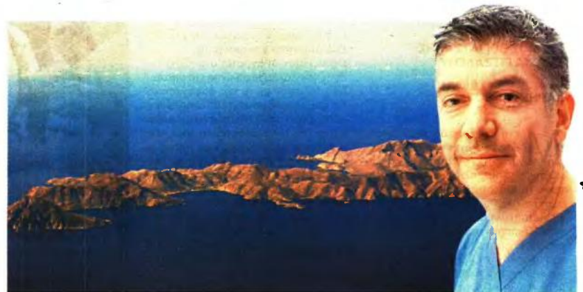
Η ΤΗΛΟΣ είναι ένα από τα 24 ακριτικά νησιά που έχει υιοθετήσει η οργάνωση του Δρ Στέφανου Χανδακά

Με τις εξετάσεις, τα πληρωμένα εισιτήρια, τη διανομή φαρμάκων και μετά με τη γέννα. Πήγαινα στην Αθήνα κάθε μήνα ή μήνα παρά μήνα και με παρακολουθούσαν. Αυτό είναι κάτι που δεν μπορεί κάποιος να το αντέξει οικονομικά. Μόνο το εισιτήριο με κομπίνα για τον Πειραιά κοστίζει 75 ευρώ. Με τις μέρες που χρειάζεται να είσαι στην Αθήνα θέλει τουλάχιστον 1.000», αναφέρει. «Θέλω να ευχαριστήσω πάρα πολύ τον κ. Χανδακά και την ομάδα του. Έχουν ένα πρόγραμμα σπουδαίο που στηρίζει τους ανθρώπους που θέλουν να κάνουν παιδιά», τονίζει.