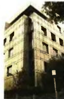
Εφεξής στο Ταμείο μπαίνουν και όλοι οι εργαζόμενοι στο Διαδίκτυο

Η εφάπαξ παροχή καταργείται για νέους δημοσιογράφους που θα ενταχθούν από τούδε και στο εξής στο Ταμείο. Όσοι είναι σήμερα ασφαλισμένοι θα πάρουν βοήθημα με διπλό υπολογισμό: Τα χρόνια μέχρι την ψήφιση της διάταξης με τον παλιό τρόπο και τα χρόνια μετά το 2017 με τον νωπή κεφαλοποίηση (νόμος Κατρούγκαλου). Η τροπολογία εντάσσει όλους τους εργαζόμενους σε ΜΜΕ στον ΕΔΟΕΑΠ, καταργώντας την προϋπόθεση ένταξης στην ΕΣΗΕΑ.