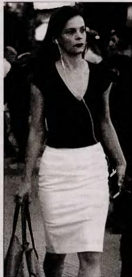
■ Η Έφη Αχτσιόγλου

Τό ίσοζύγιο τών ασφαλιστικών ταμείων προβλέπεται νά είναι τό 2018 σέ δημοσιονομικούς όρους σημαντικά βελτιωμένο έναντι του στόχου του ΜΠΔΣ 2018-2021. Πιο συγκεκριμένα τό ταμειακό ίσοζύγιο τών ασφαλιστικών ταμείων προβλέπεται νά έμφανίσει τό έπόμενο έτος πλεόνασμα 760 έκκατ. ευρώ, έναντι έλλείμματος ύψους 563 έκκατ. ευρώ του ΜΠΔΣ 2018-2021. Σέ δημοσιονομική βάση τό ίσοζύγιο προβλέπεται νά παρουσιάσει πλεόνασμα 689 έκκατ. ευρώ έναντι έλλείμματος 634 έκκατ. ευρώ του ΜΠΔΣ 2018-2021.