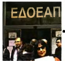
Το σχέδιο προβλέπει εισοφρές επικουρικής ασφάλισης 7%, στα πρότυπα του ΕΤΕΑΕΠ