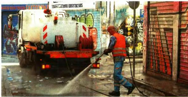
Στον Δήμο Κοζάνης θα προσληφθούν οδηγοί Απορριμματοφόρου και εργάτες Καθαριότητας

Από τις δέκα προσλήψεις που πραγματοποιεί ο Δήμος Παλλήνης, με καταληκτική ημερομηνία 28 Νοεμβρίου, τέσσερις αφορούν Εργάτες Υδρευσης, και από δύο