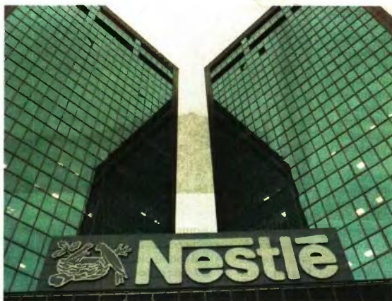
Εως το 2020 η Nestle θα προσλάβει 20.000 νέους έως 30 ετών σε εγκαταστάσεις της στην Ευρώπη, τη Μέση Ανατολή και τη Βόρεια Αφρική

Τέλος, η τέταρτη δεσμεύση της εστιάζει στη δράση «Συμμαχία για τη Νέα Γενιά - Alliance for YOUth», στοχεύοντας σε 230.000 ευκαιρίες απασχόλησης και μαθητείας μέχρι το 2020