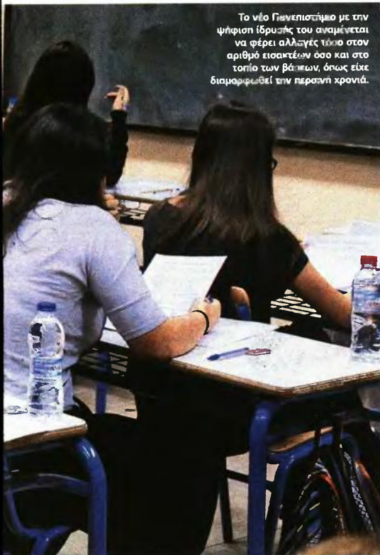
Το νέο Πανεπιστήμιο με την ψήφιση ίδρύσεώς του αναμένεται να φέρει αλλαγές τόσο στον αριθμό εισακτέων όσο και στο τοπίο των βιτίσεων, όπως είχε διαμορφωθεί την περασνή χρονιά.