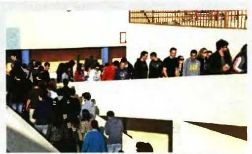
▶▶ «ΠΛΑΦΟΝ» ΚΑΙ ΣΤΑ ΩΡΙΑΙΑ ΔΙΑΓΩΝΙΣΜΑΤΑ