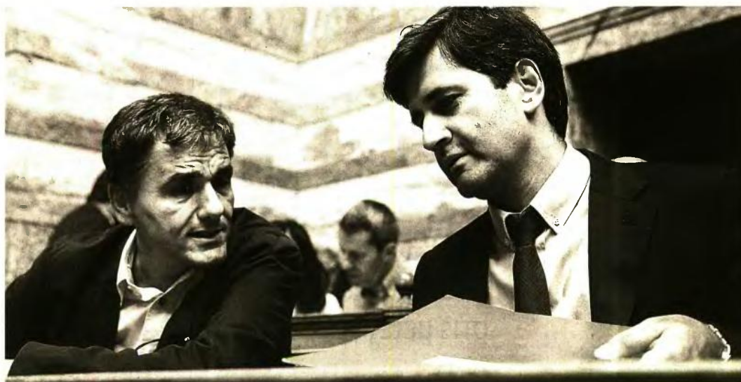
Στη συζήτηση του προσχεδίου προϋπολογισμού του 2018, Τσακαλώτος και Χουλιαράκης είχαν υπαμαρτήσει της κυβερνητικής επιλογής για υπερφορολόγηση της μεσαίας τάξης

κατώτατου μισθού ενώ στο πλαίσιο των αντιμέτρων – εφόσον εφαρμοστούν – που θα συνοδεύουν την περικοπή των συντάξεων κατά 18% και του αφορολογήτου έως και τα 5.700 ευρώ, προβλέπεται ήδη μείωση ΕΝΦΙΑ κατά 70 ευρώ για όσους επιβαρύνονται με φόρο έως 700 ευρώ, μηδενικά εισφορά αλληλεγγύης για εισοδήματα έως 30.000 ευρώ και μείωση συντελεστή φόρου εισοδήματος για τις επιχειρήσεις από το 29% στο 26%.