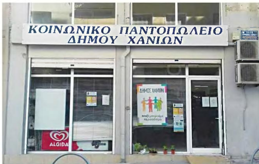
Το 88% των ωφελουμένων του Κοινωνικού Παντοπωλείου έχει συνολικό ετήσιο εισόδημα κάτω από 6.000 ευρώ, το 21% είναι ΑμεΑ, ένα 14% των ωφελουμένων είναι μονογονεϊκές οικογένειες, ενώ το 8% είναι τρίτεκνοι ή πολύτεκνοι.