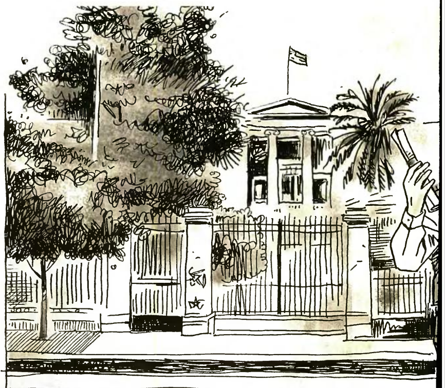
ΕΙΚΟΝΟΓΡΑΦΗΣΗ ΚΩΣΤΑΣ ΣΚΛΑΒΕΝΙΤΗΣ

Κατατέθηκε χθες στη Βουλή το νομοσχέδιο του υπουργείου Παιδείας για τη δημιουργία του νέου ΑΕΙ Δυτικής Αττικής με έδρα το Αιγάλεω. Τα τμήματά του θα ενταχθούν από φέτος στα Μηχανογραφικά Δελτία των υποψηφίων