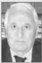
Του Βασίλη Θεοδοκόπου*

Η Εθνική Στατιστική Υπηρεσία έχει στοιχεία για τις γεννήσεις και τους θανάτους από το 1921 μέχρι και σήμερα, με εξαίρεση τα έτη από το 1941 έως και το 1948, δηλ. τα χρόνια της Κατοχής και τα επολοιούθησαντα της ανταρσίας. Δεν είναι, όμως, δύσκολο ν' ανακαλύψει κάποιος πόσες ήταν τουλάχιστον οι γεννήσεις κατά τα έτη 1943 έως και το έτος 1948. Από τα επίσημα στοιχεία της ίδιας της Στατιστικής Υπηρεσίας προκύπτει ότι κατά το σχολικό έτος 1954-1955 σε όλα τα δημοτικά σχολεία της Ελλάδας φοιτούσαν 943.813 μαθητές. Οι μαθητές αυτοί είχαν γεννηθεί κατά τα έτη 1943-1944-1945-1946-1947 και 1948.