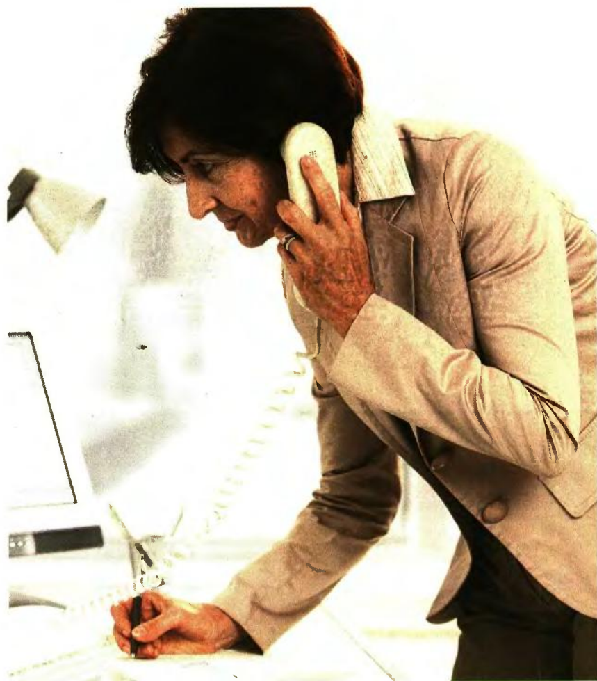
Πλήρης σύνταξη γονέων υπαλλήλων από το Δημόσιο (πρόσληψη μέχρι 1992)

6 Οι τρίτεκνες μητέρες που είχαν 20 έτη ασφάλισης το 2010 βγαίνουν στη σύνταξη χωρίς όριο ηλικίας. Ειδικά για το Δημόσιο, οι άνδρες τρίτεκνοι που είχαν 25ετία έως το 2010 και συμπλήρωσαν το 55ο έτος (τότε) αποχωρούν κατ' εξαίρεση με διατάξεις τρίτεκνων. ■