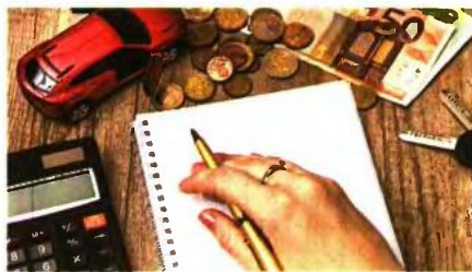
Νέοι κωδικοί για τις δαπάνες έχουν προστεθεί στις φοιτηκές δηλώσεις εισοδήματος

Σε αυτό το πλαίσιο οι αποδείξεις των δύο συζύγων ή όσων έχουν συνάψει σύμφωνο συμβίωσης θα πρέπει να συμπληρωθούν ξεχωριστά. Να ση-