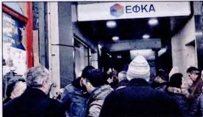
Η εγκύκλιος του ΕΦΚΑ καθορίζει δύο χρονικές περιόδους για όλες τις κατηγορίες των ασφαλισμένων, αλλά και των ανέργων για τις οποίες προβλέπεται διαφορετικός αριθμός ημερών ασφάλισης

Τ ΗΝ αύξηση των ημερών ασφάλισης από την 1/3/2019, δηλαδή του αριθμού των ενσήμων, σε 75 ημέρες για τους μισθωτούς και σε 3 μήνες ασφάλισης για τους μη μισθωτούς προβλέπει νέα εγκύκλιος του ΕΦΚΑ, σύμφωνα με την οποία καθορίζονται ενιαία για πρώτη φορά οι προϋποθέσεις χορήγησης και ανανέωσης της ασφαλιστικής ικανότητας για υγειονομική περίθαλψη σε είδος στους μισθωτούς και μη μισθωτούς ασφαλισμένους, στους συνταξιούχους και στα μέλη της οικογενείας τους.