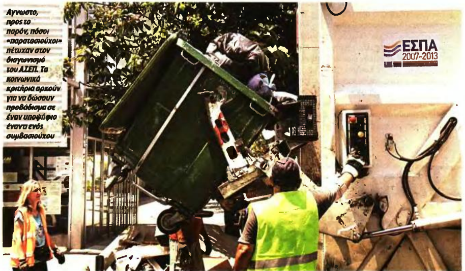
Άγνωστο, προς το παρόν, πόσοι «παρατασιούχοι» πέτυχαν στον διαγωνισμό του ΑΣΕΠ. Τα κοινωνικά κριτήρια αρκούν για να δώσουν προβάδισμα σε έναν υποψήφιο έναντι ενός συμβασιούχου

Ακολουθεί το στάδιο του ελέγχου των δικαιολογητικών των υποψηφίων από το ΑΣΕΠ, καθώς