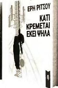
Πάνω η Ερη Ρίτσου με τη μητέρα της, Φαλίτσα (Γαρυφαλιά) Γεωργιάδου-Ρίτσου και τον πατέρα της Γιάννη Ρίτσο. Αριστερά, ανάμεσα στους συμμαθητές της από το Γυμνάσιο Καρλοβασιού Σάμου. Το τελευταίο της μυθιστόρημα, «Κάτι κρέμεται εκεί ψηλά», κυκλοφορεί από τις εκδόσεις Κέδρος

Ο ΣΥΡΙΖΑ ισχυρίστηκε πως είναι μια αριστερή κυβέρνηση, αλλά γνωρίζουμε όλοι πως δεν είναι. Δεν τους ψηφίσαμε, άρα, λογικά, δεν αποθνήσκου προδομένη ως αριστερά. Εξοργισμένη όμως μαζί τους που προσποιούνται πως είναι αριστεροί; Και με όσους τους ψηφίσαμε;