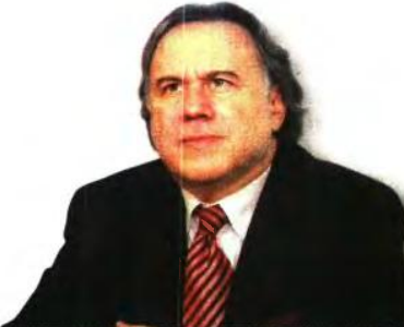
Την ίδια στιγμή που τα έσοδα του ΟΑΕΕ έπεσαν στο 7μηνο του 2016 κατά 5,8% και τα φορολογικά έσοδα απέκλιναν κατά 2,2% το στόχο, η κυβέρνηση ετοιμάζεται από 1/1/2017 να επιβάλει το ασφαλιστικό «χαράτσι» 20% στους επαγγελματίες.

● Την ίδια στιγμή που η κυβέρνηση «φορτώνει» τον κρατικό Προϋπολογισμό με βραχυβία «αντισταθμικά» μέτρα παραμένει εντελώς αδιευκρίνιστο από πού θα αυξηθούν κατά 800 εκατ. ευρώ το 2017 τα έσοδα από ασφαλιστικές εισφορές – όπως προβλέπει η πιο πρόσφατη μελέτη της Εθνικής Αναλογιστικής Αρχής.