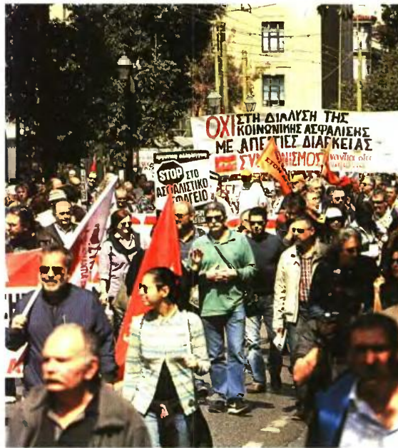
Φωτογραφία από την απεργιακή συγκέντρωση και πορεία της ΑΔΕΔΥ ενάντια στο νέο Ασφαλιστικό την περασμένη Πέμπτη

Στο τραπέζι παραμένει το σενάριο αλλαγών στο ύψος των ποσοστών αναπλήρωσης, που αφορούν