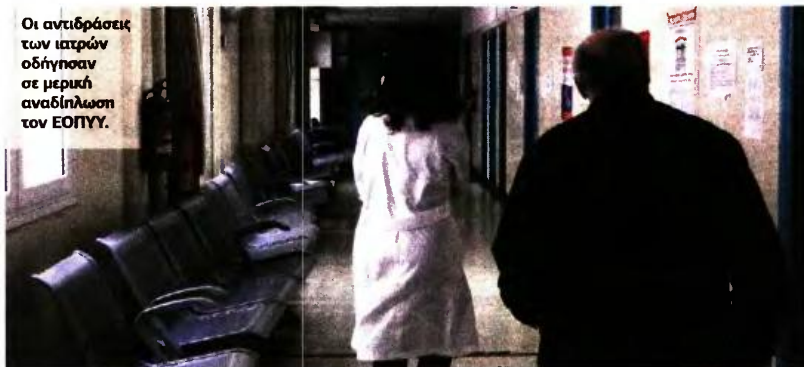
Οι αντιδράσεις των ιατρών οδήγησαν σε μερική αναδίπλωση τον ΕΟΠΥΥ.

► ΜΕΣΟΣ ΟΡΟΣ 20 ΕΠΙΣΚΕΨΕΙΣ ΤΗΝ ΗΜΕΡΑ ΣΤΟΥΣ ΣΥΜΒΕΒΛΗΜΕΝΟΥΣ ΙΑΤΡΟΥΣ