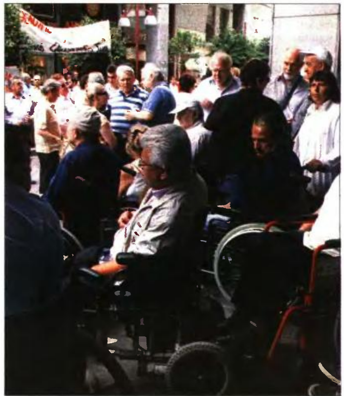
Από συγκέντρωση διαμαρτυρίας ατόμων με αναπηρία κατά των περικοπών στα επιδόματά τους

Αντίθετα, θα αυξηθούν τα συγκεκριμένα επιδόματα κατά 250.000.000 ευρώ (εφόσον επιτευχθούν οι δημοσιονομικοί στόχοι του 2018), με βασικές ωφελούμενες τις οικογένειες με ένα ή δύο παιδιά. Μέσα στο επόμενο τρίμη-