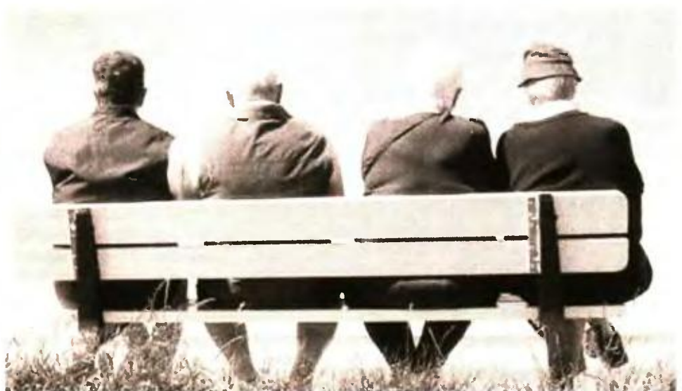
Λιγότερες γεννήσεις στην Ελλάδα και πληθυσμιακή γήρανση, με κίνδυνο φτώχειας για τους ηλικιωμένους

Η μελέτη επισημαίνει ότι μεταξύ 2011-2016 η Ελλάδα έχασε σχεδόν το 3% του πληθυσμού της, μεταξύ άλλων λόγω της γέννησης λιγότερων παιδιών εξαιτίας της οικονομικής κρίσης. Προβλέπει ότι από περίπου 10,8 εκατομμύρια το 2016, ο πληθυσμός της χώρας μας θα μειωθεί στα 9,9 εκατομμύρια έως το 2030 και στα 8,9 εκατομμύρια έως το 2050, με συνέπεια να υποστεί μια πρόσθετη μείωση κατά περίπου 18%. Με δείκτη ολικής γονιμότητας 1,33 (ο προβλεπόμενος μέσος αριθμός παιδιών ανά γυναίκα), η Ελλάδα έχει σήμερα σχεδόν τη χαμηλότερη επίδοση στην Ευ-