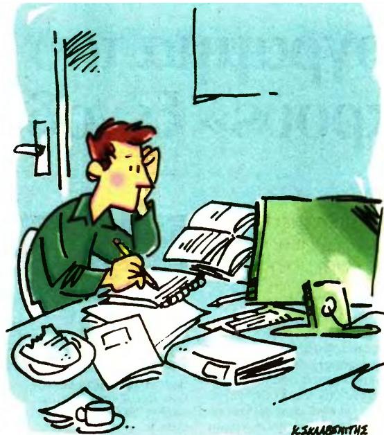
ΤΟΥ ΚΩΣΤΑ ΣΚΛΑΒΕΝΙΤΗ

Είναι χαρακτηριστικό ότι έως τώρα από τους 8.000 οφειλότες που έχουν κάνει είσοδο στο σύστημα, μόλις οι 1.500 - ή 1 στους 5 - έχουν καταφέρει να περάσουν τα κριτήρια έντα-