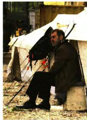
Ο χειμώνας έρχεται και οι πρόσφυγες, ακόμη, κοιμούνται σε σκηνές.

Οι σπασμωδικές κινήσεις του αρμόδιου υπουργού και η εμφανής έλλειψη συγκεκριμένου σχεδίου συνεχίζουν να προκαλούν δυσφορία σε πολλά στελέχη του ΣΥΡΙΖΑ, που θεωρούν ότι η κακή διαχείριση του προσφυγικού και τυχόν νέες εικόνες ντροπής που θα δούμε τους επόμενους μήνες θα πλήξουν ακόμη περισσότερο το λεγόμενο αριστερό προφίλ του κόμματος. ■