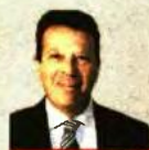
ΤΟΥ ΓΙΩΡΓΟΥ ΚΥΡΤΖΟΣ Ευρωβουλευτή της Ν.Δ.

Τα μέτρα που πήρε η κυβέρνηση Τσίπρα σε βάρος των φτωχότερων συμπολιτών μας είναι εντυπωσιακής κοινωνικής σκληρότητας.