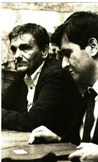
Τα μέτρα που έχει λάβει το οικονομικό επιτελείο (στη φωτο) ο υπουργός και ο αναπληρωτής υπουργός Οικονομικών, Ευκλ. Τσακαλώτος και Γ. Χουλιαράκης, αντίστοιχα, την τελευταία τριετία έχουν φραμάξει τον ελληνικό λαό.

41 Μειώνονται τα αφορολόγητα όρια εισοδήματος για μισθωτούς, συνταξιούχους και κατ'επάγγελμα αγρότες από 8.636 έως 9.545 σε 5.682 έως 6.591 ευρώ. ■