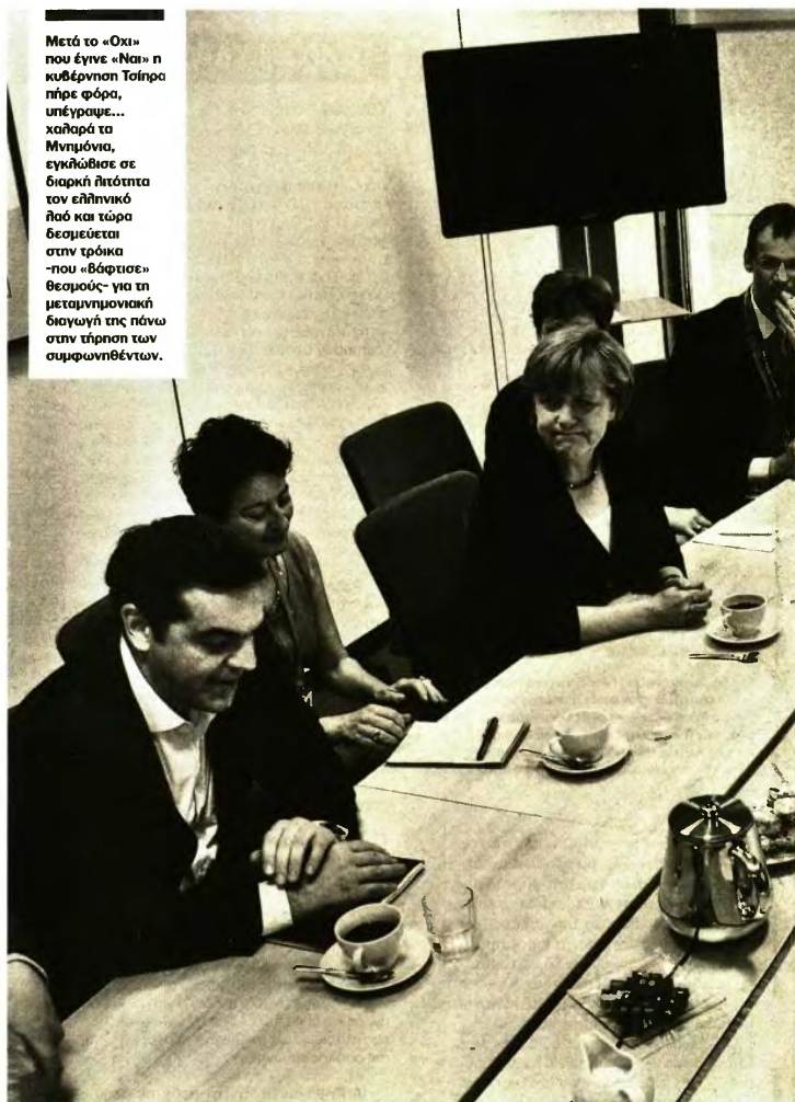
Μετά το «Οχι» που έγινε «Ναι» η κυβέρνηση Τσίπρα πήρε φόρο, υπέγραψε... χαράρα τα Μνημόνια, εγκλώβισε σε διαρκή λιτότητα τον ελληνικό λαό και τώρα δεσμεύεται στην τριόικια -που «βάφτισε» θεσμούς- για τη μεταμνημονιακή διαγωγή της πάσης στην τήρηση των συμφωνηθέντων.

Το δεύτερο σενάριο είναι γνωστό από το 2014 και αφορά στη συνέχιση του προγράμματος με πιο καλαρή εποπτεία και μια προληπτική πιστωτική γραμμή ως εναλλακτική λύση χρηματοδότησης από τον ESM. Το