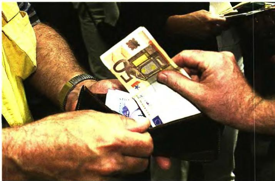
Πάνω από 1,1 δισ. ευρώ θα επιστρέψει στο πορτοφόλι όσων δικαιούνται να λάβουν το κοινωνικό μερίσμα, σύμφωνα με εκτιμήσεις της κυβέρνησης