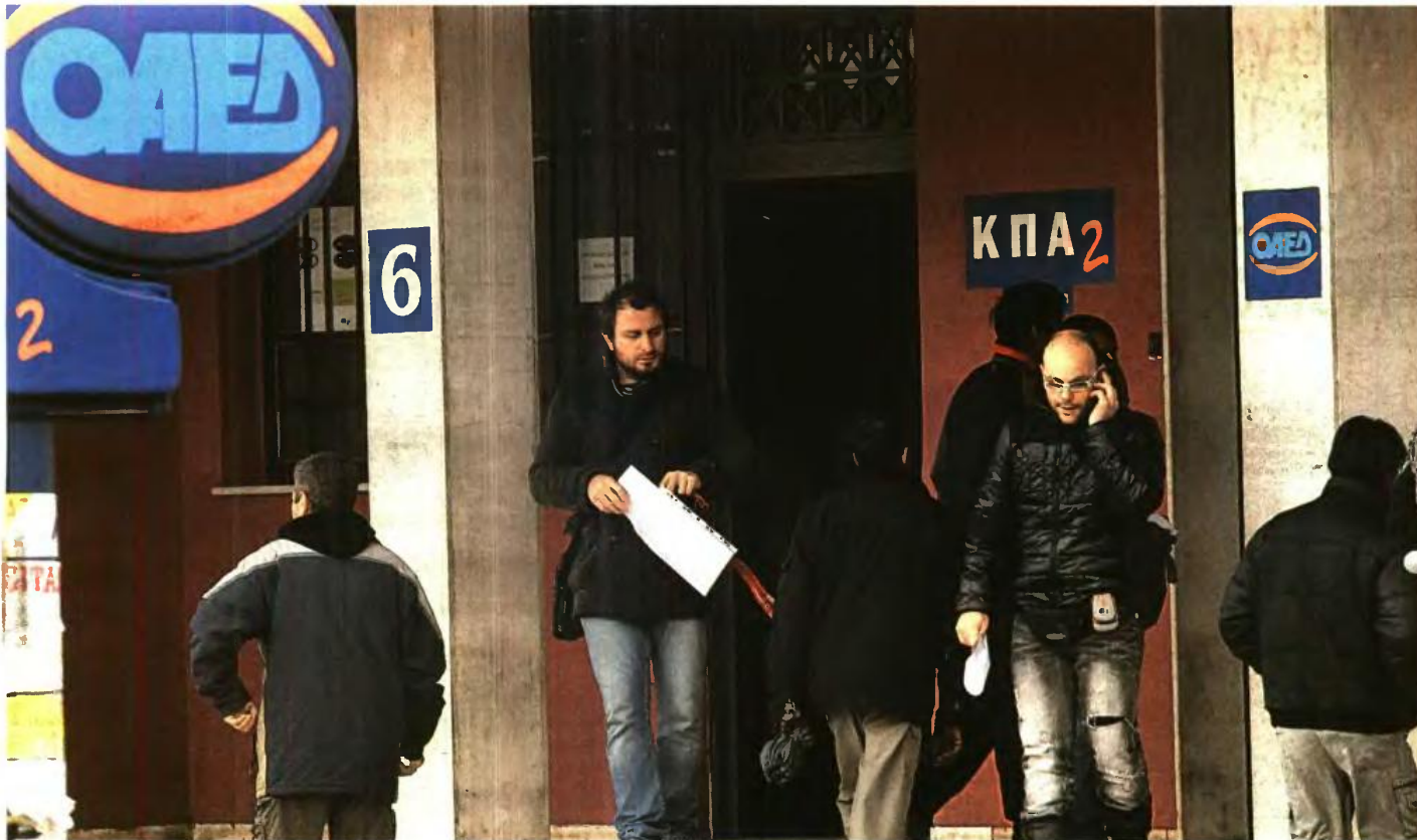
Λόγω της εκδήλωσης μεγάλου ενδιαφέροντος από πτυχιούχους για την υπαγωγή στο πρόγραμμα ενισχύσεων δόθηκε παράταση έως τις 10 Μαΐου