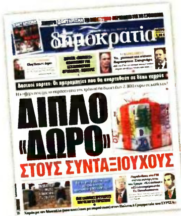
Το πρωτοσέλιδο της «δημοκρατίας» στις 31 Οκτωβρίου 2017

Μεγάλοι κερδισμένοι θα είναι τα λεγόμενα «ρετιρέ», δηλαδή συνταξιούχοι ΔΕΚΟ-τραπεζών, συνταξιούχοι γιατροί του ΕΣΥ, συνταξιούχοι μέλη ΔΕΠ, συνταξιούχοι ένστολοι, δημόσιοι υπάλληλοι με υψηλές θέσεις, που λάμβαναν το 2012 μεγάλες συντάξεις, άρα υπέστησαν και «γενναίες» περικοπές υπέρ του ΕΟΠΥΥ. Η οικονομική ενίσχυση των χαμηλοσυνταξιούχων, των