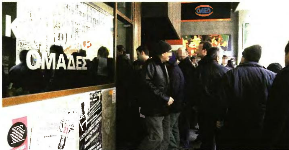
Το μέσο ύψος του μερίσματος ανά νοικοκυριό αναμένεται να ανέλθει σε 483 ευρώ

Σύμφωνα με τον προϋπολογισμό του 2018 που κατατέθηκε στη Βουλή, το μέσο ύψος του μερίσματος ανά νοικοκυριό αναμένεται να φτάσει στα 483 ευρώ και θα διανεμηθεί σε 1,459 εκατομμύρια νοικοκυριά. «Μέχρι το τέλος του μήνα που διανύουμε θα έχει ανοίξει η πλατφόρμα» τόνισε, από την πλευρά της, χθες η αναπληρώτρια υπουργός Κοινωνικής Αλληλεγγύης, Θεανώ Φωτιάου. Εξηγώντας ταυτόχρονα αναλυτικά τα βήματα που πρέπει να ακολουθήσουν οι δικαιούχοι για να λάβουν το μέρισμα: ■ Αρχικά μπαίνουν στην πλατφόρμα www.koinonikomerisma.gr και εισάγουν τους προσωπικούς τους κωδικούς του Taxis. Εκεί δηλώνουν έναν αριθμό κινητού τηλεφώνου και μια ηλεκτρονική διεύθυνση email, ώστε οι αρμόδιες υπηρεσίες να μπορούν να επικοινωνήσουν μαζί τους, αν αυτό χρειαστεί. Επίσης δηλώνουν τον ΑΜΚΑ τους. Το