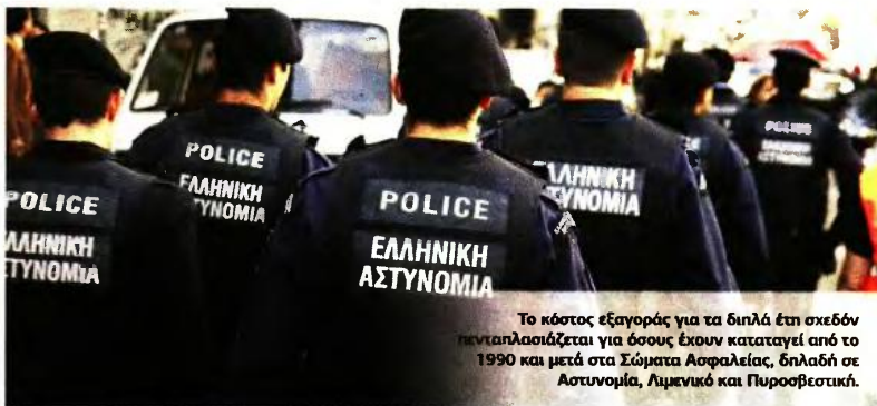
Το κόστος εξαγοράς για τα διπλά έτη σχεδόν πενταπλασιάζεται για όσους έχουν καταταγεί από το 1990 και μετά στα Σώματα Ασφαλείας, δηλαδή σε Αστυνομία, Λιμενικό και Πυροσβεστική.

Ο επανυπολογισμός τους ευνοεί μεν, αλλά ο νόμος έχει παγώσει κάθε αύξηση συντάξεων ως και το 2022. Οπότε μέχρι τότε θα μείνουν στα ίδια με σήμερα ποσά σύνταξης. ■