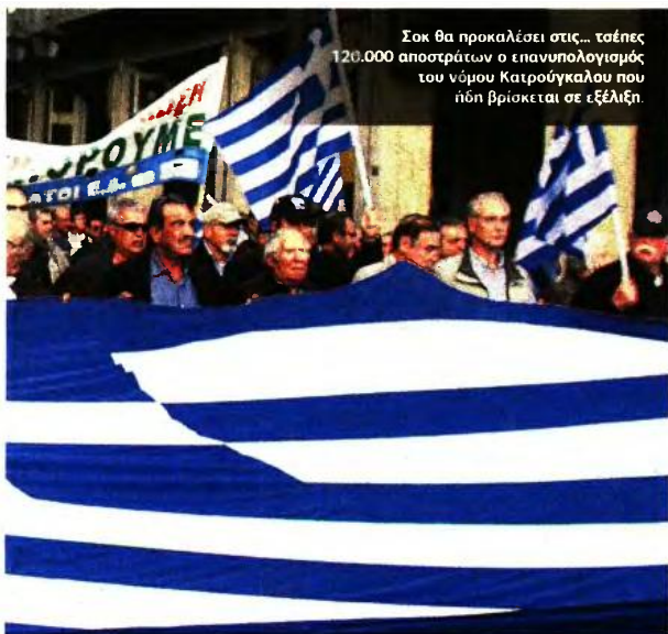
Σοκ θα προκαλέσει στις... τάξεις 120.000 αποστράτων ο επανουπολογισμός του νόμου Κατρούγκαλου που ήδη βρίσκεται σε εξέλιξη.