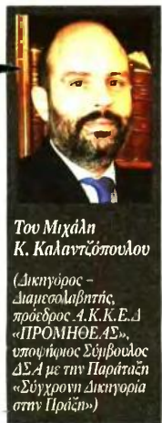
Του Μιχάλη Κ. Καλαντζόπουλου

Έτσι, η Δικαιοσύνη μέσω της προσφυγής του πολίτη στα δικαστήρια για την προάσπιση των συμφερόντων του από κοινωνικό αγαθό έχει μετατραπεί σε πρόνομο ολίγων. Αυτό βέβαια έχει άμεσο αντίκτυπο και στο επάγγελμα του δικηγόρου αφού η δικηγορική ύλη ολοένα και συρρικνώνεται.