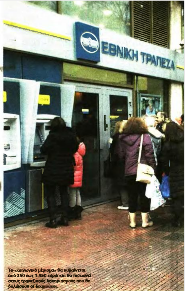
Το «κοινωνικό μέρισμα» θα κυμαίνεται από 250 έως 1.350 ευρώ και θα πιστωθεί στους τραπεζικούς λογαριασμούς που θα δηλώσουν οι δικαιούχοι.

Για την καταβολή του «μερίσματος» στις υπόλοιπες κατηγορίες νοικοκυριών, με περισσότερα του ενός μέλη, τόσο τα κλιμάκια ετησίου εισοδήματος