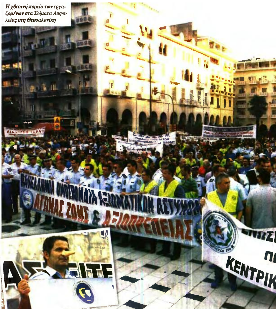
Η χθεσινή πορεία των εργαζομένων στα Σώματα Ασφαλείας στη Θεσσαλονίκη

ΜΕ 24ΩΡΗ απεργία που έχουν εξαγγείλει η ΕΣΗΕΑ και η ΠΟΣΠΕΡΤ, στην οποία θα συμμετέχουν όλα τα δημόσια και ιδιωτικά κανάλια πλην του Αιθή, όπως το ίδιο ανακοίνωσε, απαντούν σήμερα οι εργαζόμενοι στον χώρο των ΜΜΕ στο «μαύρο» που ετοιμάζεται να ρίξει η κυβέρνηση στα κανάλια που δεν πήραν άδεια. Η χρονική στιγμή δεν είναι τυχαία, αφού οι κινητοποιήσεις γίνονται ανήμερα των εγκαίνιων της ΔΕΘ, με σκοπό να μην προβληθεί η ομιλία του πρωθυπουργού, κάτι που τελικά όμως φαίνεται πως θα γίνει. Και αυτό καθώς τα δύο δημόσια κανάλια ΕΡΤ1 και ΕΡΤ2 θα μεταδώσουν με εικόνα και ήχο, αλλά δεν θα έχουν δημοσιογραφικές εξαπομπές και πολιτικούς σχολιαστές. Το web tv της κρατικής τηλεόρασης, ωστόσο, όπως και η ΕΡΤ3, δεν έχουν τη δέσμευση να συμμετέχουν στην απεργία, καθώς ως μέσα δεν ανήκουν στην ΕΣΗΕΑ. Επιπλέον, η ΕΡΤ θα έχει συνεργείο σε βάρδια επιφυλακής, προκειμένου να δώσει εικόνα σε όποιον άλλον σταθμό το επιθυμεί, σε περίπτωση που αποφασίσει να «σπάσει» την απεργία. Η απεργιακή κινητοποίηση θα διαρκέσει μέχρι τα ξημερώματα της Κυριακής (06.00).