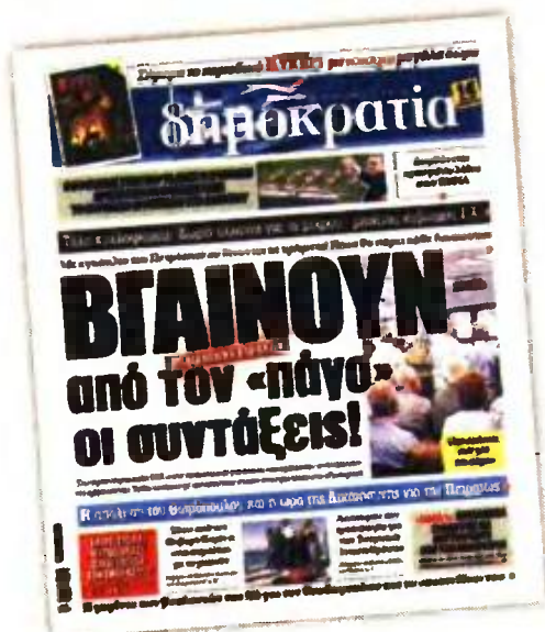
Το θέμα των νέων συντάξεων στη «δημοκρατία» της 20ής Σεπτεμβρίου