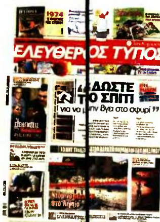
Τη λύση της εθελοντικής παράδοσης ακινήτων είχε αποκαλύψει ο «Ε.Τ.» της Κυριακής στις 23 Ιουλίου.

Πιο αναλυτικά, σύμφωνα με πληροφορίες του capital.gr, η Eurobank άνοιξε πρώτη το... χορό, προτείνοντας σε δανειολήπτη της, με οφειλή ύψους 500.000 ευρώ, να παραδώσει το ακίνητο, για το οποίο η τράπεζα έχει ήδη βρει αγοραστή. Το υπόλοιπο της οφειλής, το οποίο δεν θα καλυφθεί από το ποσό της αγοραπωλησίας, ανα-