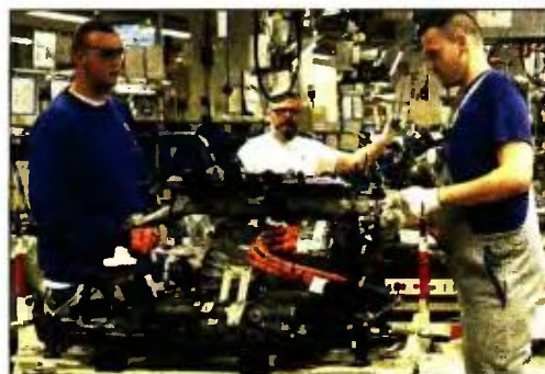
Γερμανοί εργάτες. Είναι οι πλέον αποδοτικοί, αλλά... λιγότευουν επικίνδυνα, λόγω της υπογεννητικότητας στη χώρα

Περισσότερο απ' όλα όμως, το οικονομικό θαύμα της Γερμανίας απειλείται από τον ίδιο της τον πληθυσμό. Η υπογεννητικότητα ήδη πλήττει τη χώρα –αναμένεται να πλήξει και την ανάπτυξη της οικονομίας– και αποτελεί ένα από τα σημεία τριβής στην προε-