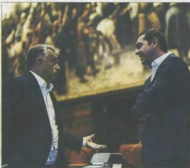
Ο Βίκτορ Ορμπάν με τον Αλέξη Τσίπρα σε πρόσφατη συνάντησή τους

Ενα «πανεπιστήμιο» που είχε «ιδεολογικό πρόσημο», πράγμα ανήκουστο για ολόκληρη τη Δύση. Είναι χαρακτηριστικό ότι τα διεθνή πρακτορεία ειδή-